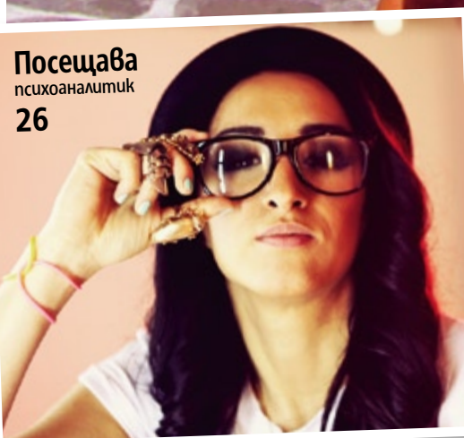
Посещава психоаналитик 26