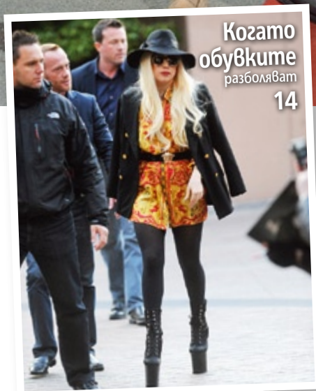
Когато обувките разболяват 14