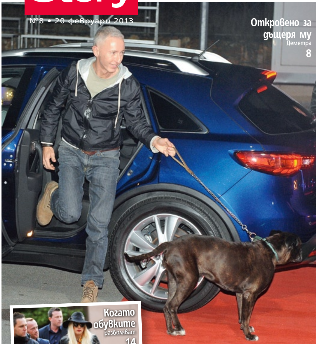
Снимка: Корсиа, Алия Йотова