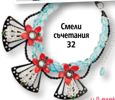
Смели съчетания 32

Посетете страницата ни във facebook списание „Story“