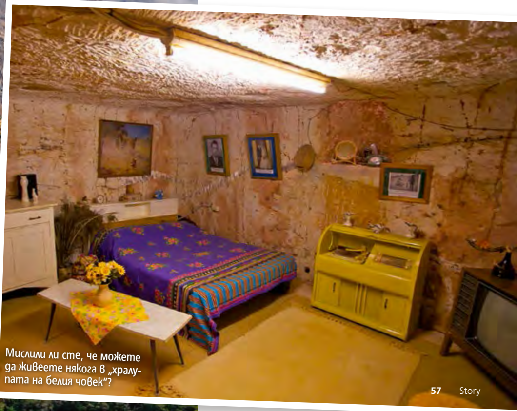
Мислили ли сте, че можете да живеете някога в „хралящата на белия човек“?

Жителите на острова-вулкан Аогашима толкова са свикнали с постоянната опасност, че са на мнение, че подобен начин на живот си е съвсем в реда на нещата. Отстрани може и да изглежда, че двойният кратер, издигащ се над морето, не е пригоден за живот, само че островитяните не са съгласни с тази гледна точка. Подобни пусти места в гъстонаселената Япония могат да се преброят на пръстите на едната ръка и те се считат за щастливци, че живеят именно на подобно парче земя. ▶