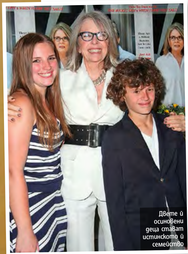
Двете ѝ осиновени деца стават истинското ѝ семейство

Първият, който изненадващо се влюбва в Даян, е Уги Алън. Екскентричният комик, който никога не е правил филми за жени, открива природата им именно чрез Кийтън. Любовта им е повече от странна. Запознават се на прослушване, където Даян се явява за ролята на партньорка на Уди. Не стига, че е притеснена и неуверена в себе си, а е и с няколко сантиметра по-висока от него. Но Алън инстинктивно усеща, че е намерил това, което търси. Кара я да се събуе боса и да застане до него, само за да установи, че няма проблем. Така Даян Кийтън получава ролята в Play It Again, Sam . „Помислих си, ▶