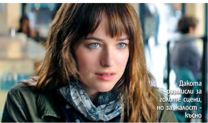
Дакота размисли за голите сцени, но за жалост - късно