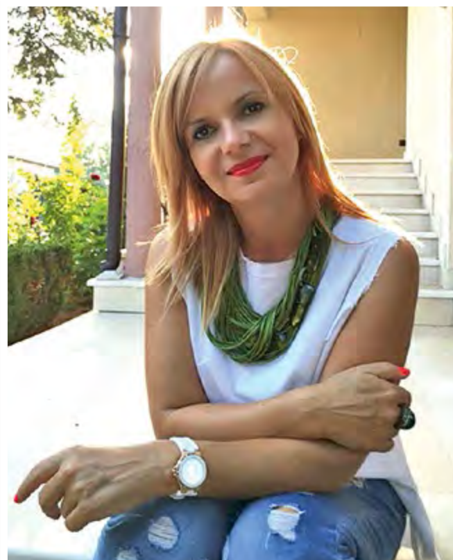
АВТОР: ДОРА ПРАНГАДЖИЙСКА, DORAPRANGADZHIYSKA.COM

Детето се ражда в очакване на любов. Вдишвайки първата глътка въздух, неговото сърце вече е отворено, за любовта на мама. Когато обаче в тази първа фаза от развитието ни мама е била физически или емоционално дистантна, детето преживява себе си като отхвърлено и това се запечатва в неговата телесна памет. Тези хора имат способността да се изолират в един прекрасен фантазен свят, далеч от реалността. Дълбоко в себе си имат неопишуема нужда от любов, но те самите често я отхвърлят, за да не преживеят отново онзи детински ужас, който за тях е бил равен на умирање. Нерядко се превръщат в привидно отчуждени и далечни хора, които не показват чувства, но под това се крие огромната нужда да бъдат обичани. Понякога избягват живия физичен контакт, защото в клетъчната им памет е запечатано, че живеят физичен човек отхвърля, но свържеш ли се с него, разбираш, че отдолу се крие едно пълно с любов сърце.