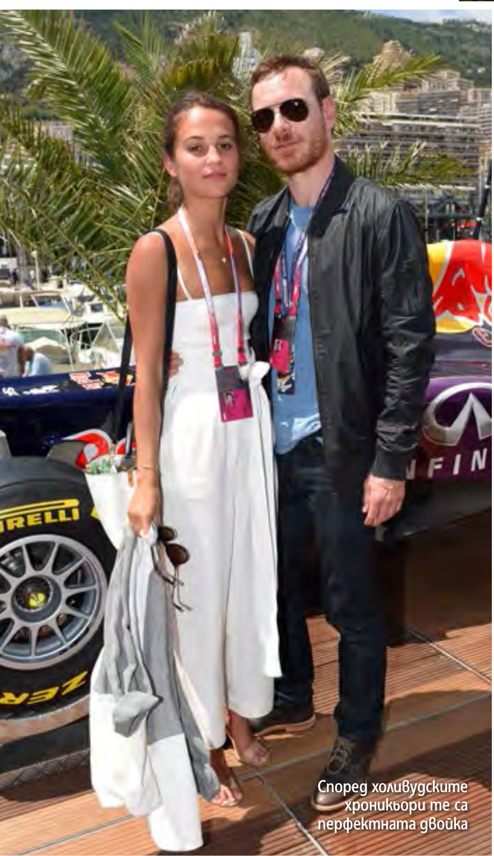
Според холивудските хроникьори те са перфектната двойка