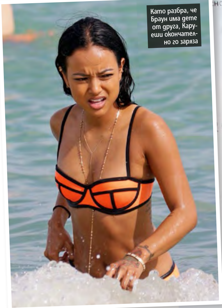
Като разбра, че Браун има дете от друга, Каруеши окончателно го заряза