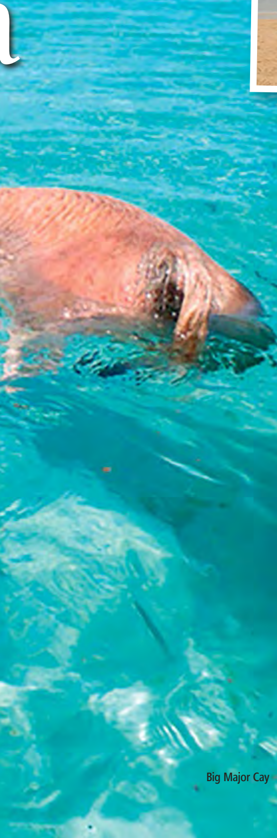
Big Major Cay