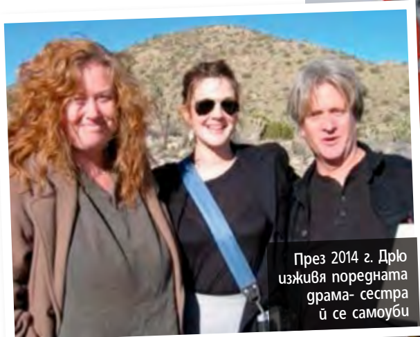
През 2014 г. Дрю изживя поредната грама-сестра ѝ се самоуби

Жена, чиято кола била запущена от автомобила на Джесика, открила безжизненото й тяло на предната