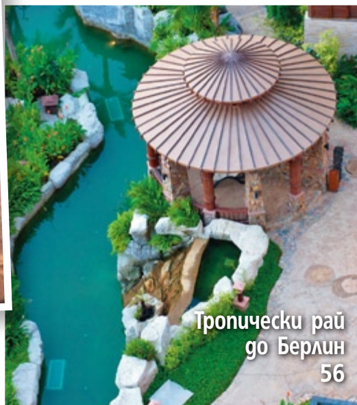
Тропически рай го Берлин 56