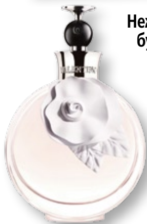
Нежност в бутилка 40

Посетете страницата ни във facebook списание „Story“