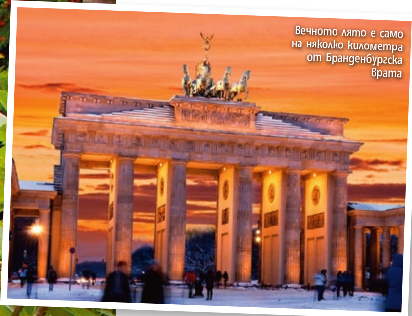
Вечното лято е само на няколко километра от Бранденбургска врата