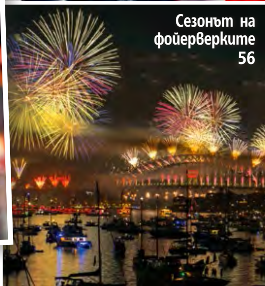
Сезонът на фойерверките 56

Посетете страницата ни във facebook списание „Story“