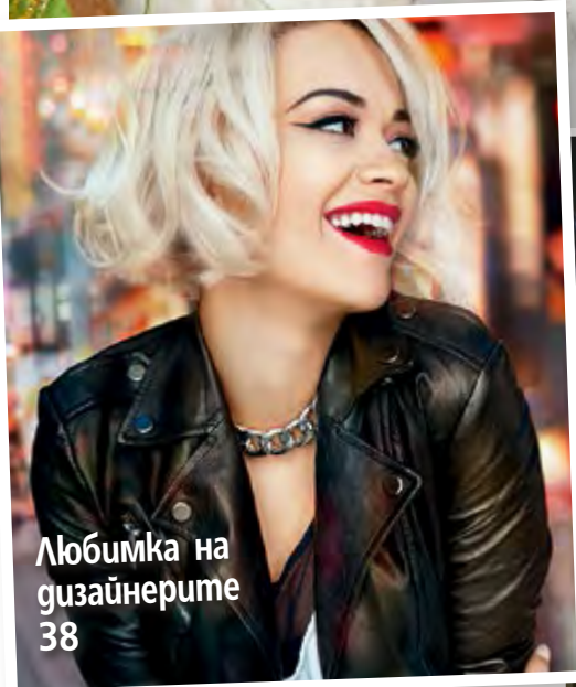
Любимка на дизайнерите 38