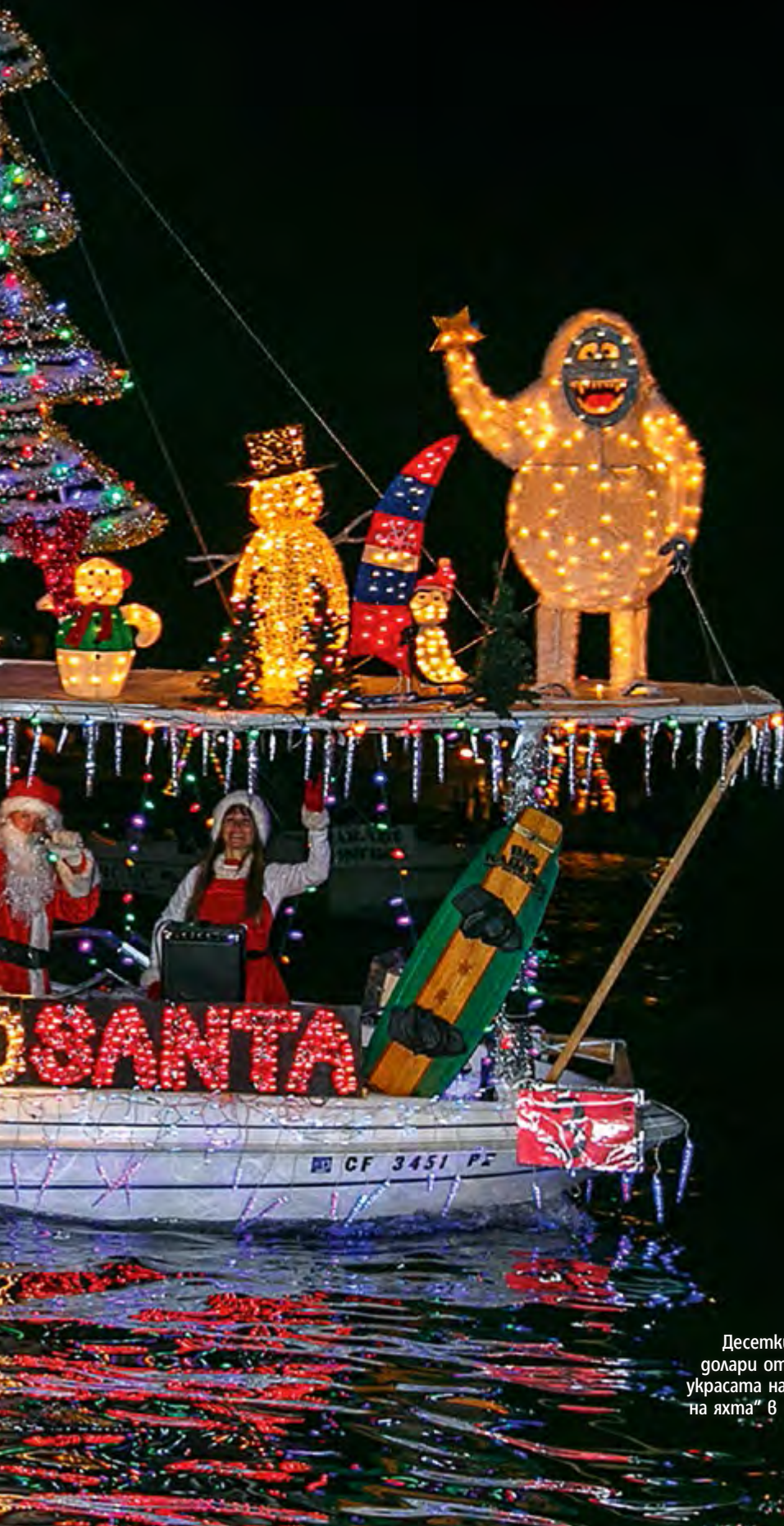
Десетки хиляди долари отиват за украсата на „Коледа- на яхта“ в Нюпорт

Плажът Копакабана в Рио и пристанищният мост в Сидни водят класацията на фестивалите на ФОЙЕРВЕРКИТЕ, Нюпорт празнува на яхти, а в Дарингтън пускат плаващи елхи