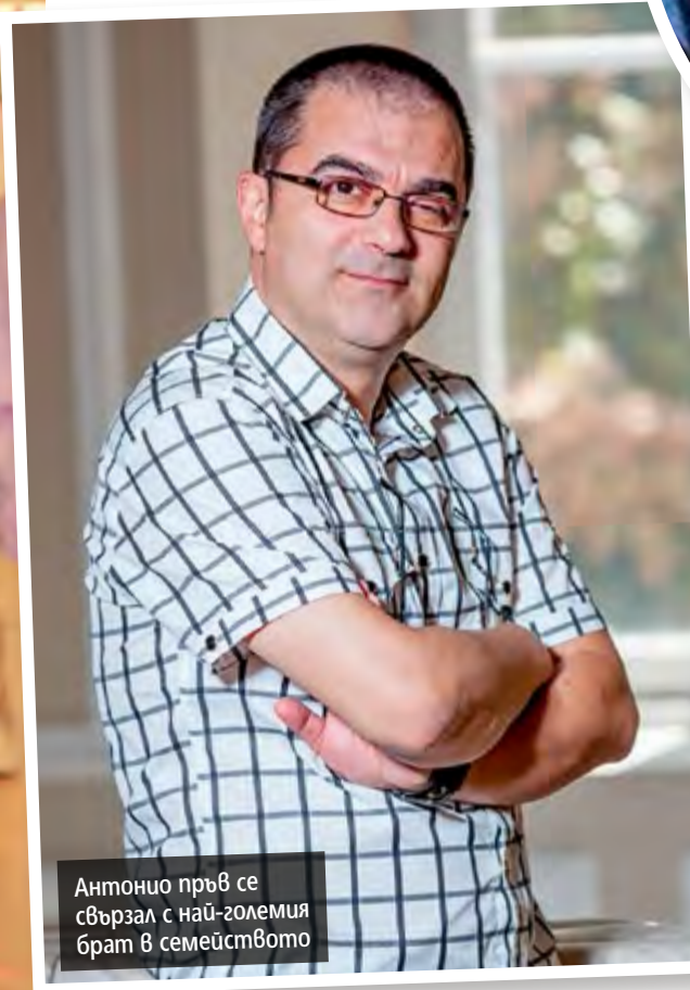
Антонио пръв се свързал с най-големия брат в семейството

изненадващо късно разбрал, че освен родния си брат, с когото израства, има и още един, от първия брак на баща си