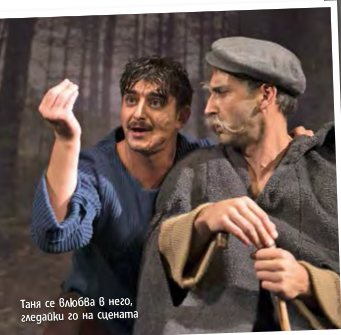
Таня се влюбва в него, гледайки го на сцената