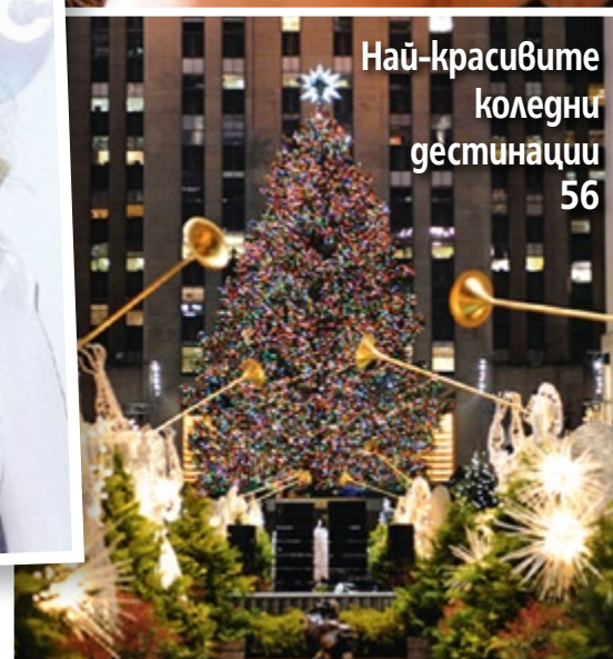
Най-красивите коледни гестинации 56