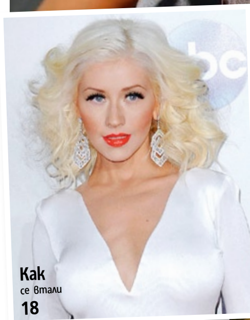
Как се втали 18