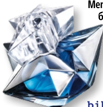
Метален блясък 42

Посетете страницата ни във facebook списание „Story“