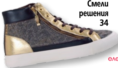
Смели решения 34

Посетете страницата ни във facebook списание „Story“