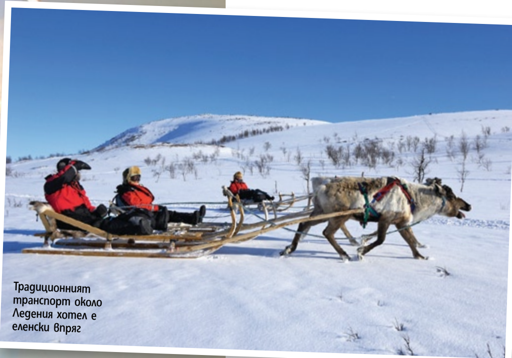
Традиционният транспорт около Ледения хотел е еленски впряг

В сърцето на ШВЕЦИЯ можете да отидете на класически концерт с кьнки, да хапнете мечешко, а зад полярната окръжност ви очаква новият стар леден хотел