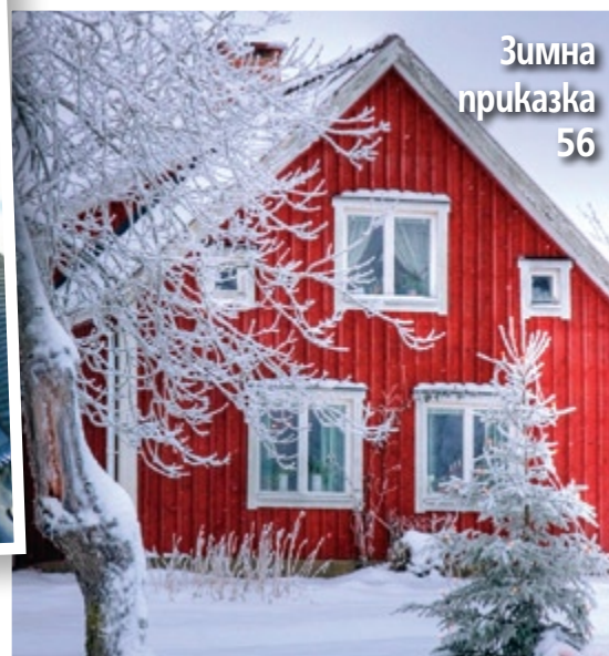
Зимна приказка 56