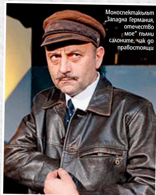
Моноспектакълът „Западна Германия, отечество мое“ пълни салоните, чак го правостоящи

„Българи са онези, които навреме избягаха от държавата. Родината ти е там, където ти плащат добре. А когато я напускаш, вината не е в теб, а в тези, които те гонят.“