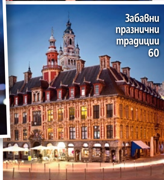
Забавни празнични традиции 60

Посетете страницата ни във facebook списание „Story“