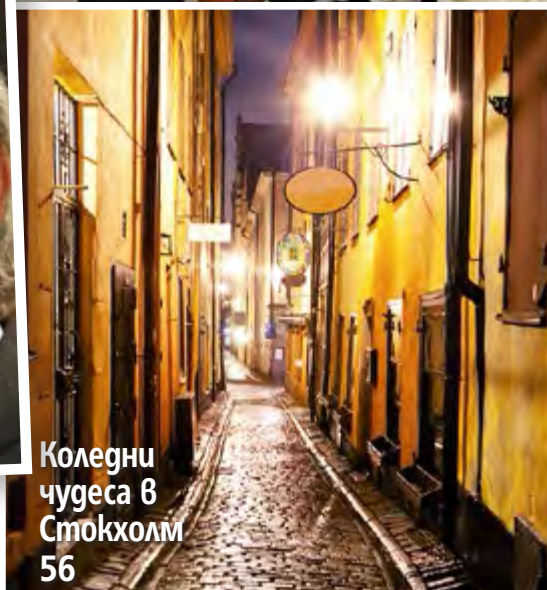
Коледни чудеса в Стокхолм 56