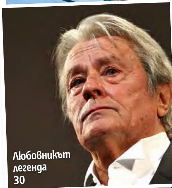
Любовникът легенда 30