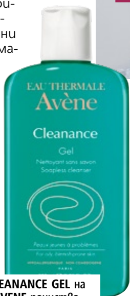
CLEANANCE GEL на AVÈNE почиства мазната кожа и я матира. (22,50 лв.)

Ако имате нормална кожа, може да използвате кърпички или тоалетно мляко, които имат омекотяващи съставки. Измиващият гел и тоникът също са подходящи за нея, защото няма опасност от изсушаване и омазняване. Сухата и чувствителна кожа обаче изисква специални грижи, като при нея може да комбинирате няколко продукта – първо тоалетно мляко, след това тоник и накрая идва ред на хидратиращия крем. Много често използвана съставка е бадемовото масло. Още в древен Китай лекарите са го предписвали като лек за раздразнения. Неговите ненаситени киселини са много подобни до естествените липиди на кожата, така че идеално допълват липидната ѝ бариера. Препоръчваме ви и мицеларен разтвор, който пък ви спестява няколко стъпки, защото едновременно почиства грима и замърсяванията и заедно с това има освежаващ тонизиращ ефект. Мазната и комбинирана кожа пък се нуждае от премахване на излишния себум, който причинява запушване на порите и оттам поява на черни точки, а след това и от матиране. Именно затова често продуктите за мазна и комбинирана кожа включват в състава си салицилова киселина. Дерматологични лаборатории Avène пък използват нова себорегулираща съставка глицерил лаурат за серията си Cleanance, която помага на кожата с акне.