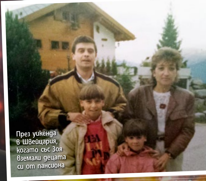
През уикенда в Швейцария, когато със Зоя вземали децата си от пансиона

АТАНАС ЛОВЧИНОВ от X Factor оставил от съвсем малки децата си сами в чужбина, но те днес са му благодарни