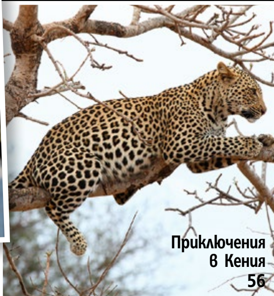
Приключения в Кения 56