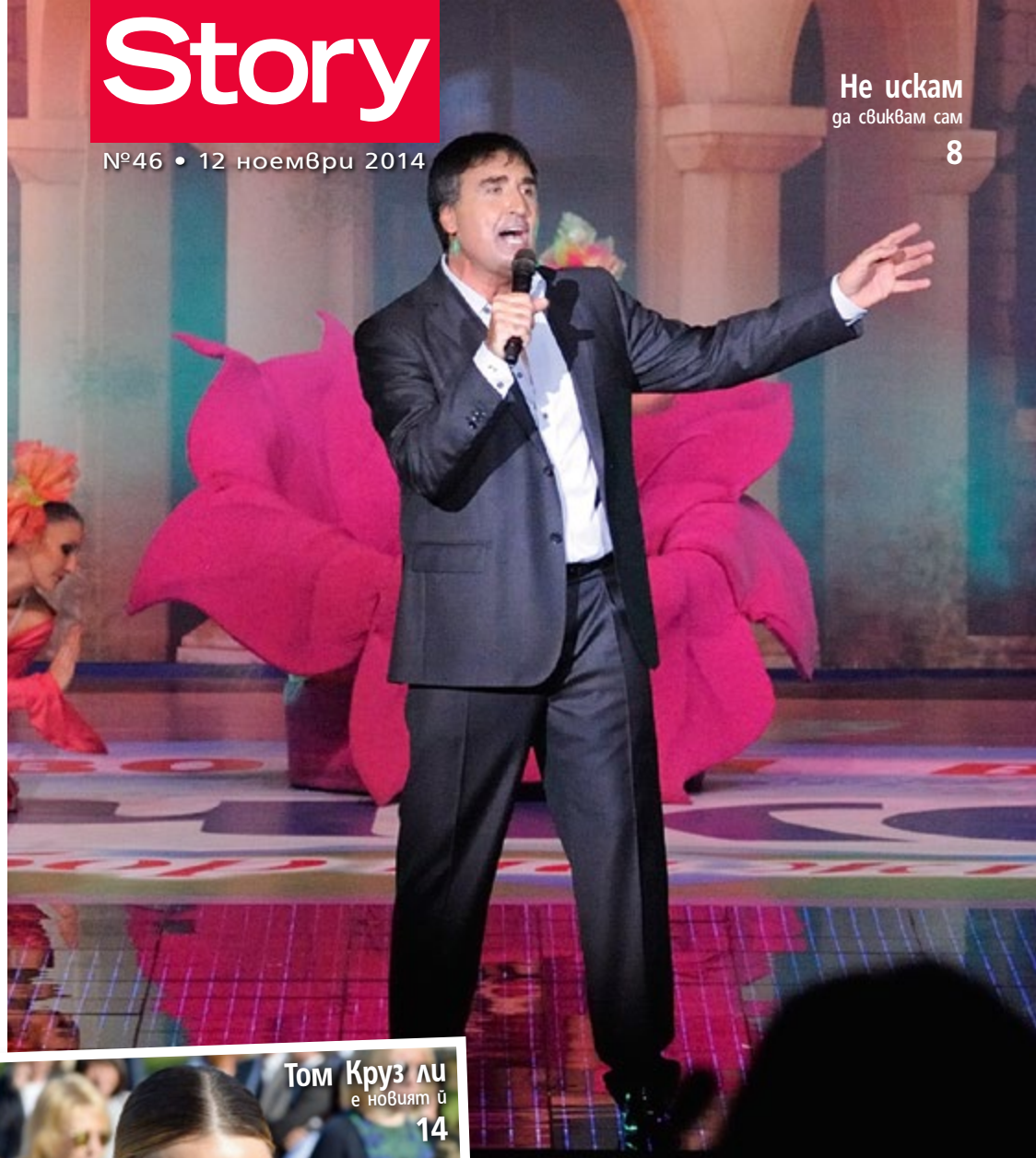
Том Круз ли е новият ѝ 14