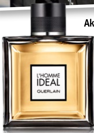
Актуалните аромати 40