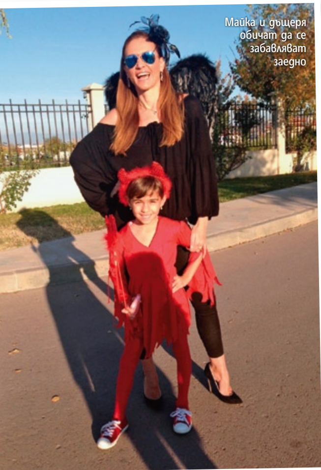
Майка и дъщеря обичат да се забавляват заедно