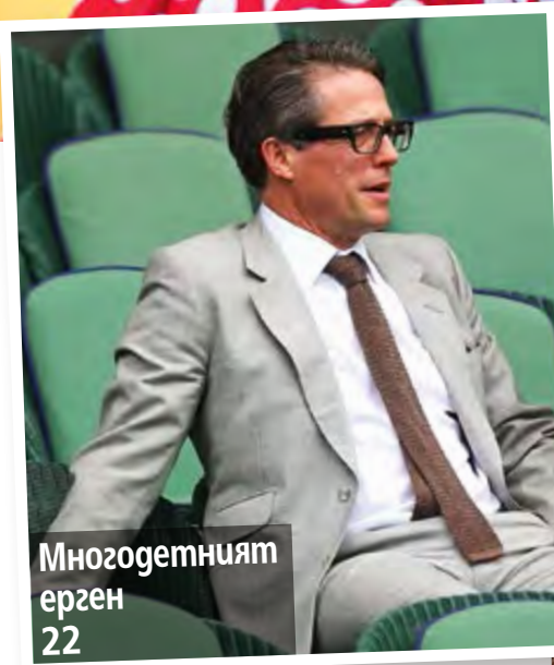
Многодетният ерген 22