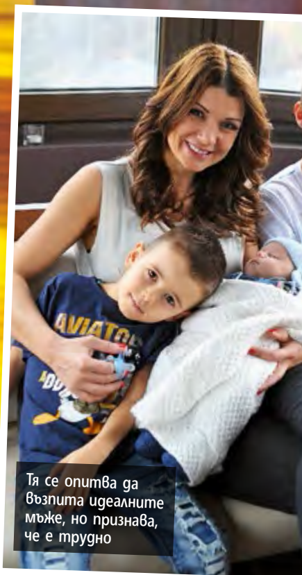
Тя се опитва да възпита идеалните мъже, но признава, че е трудно