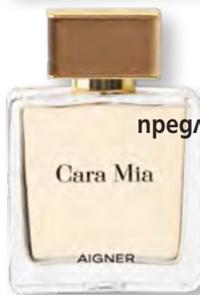
Есенни предложения 40

Посетете страницата ни във facebook списание „Story“