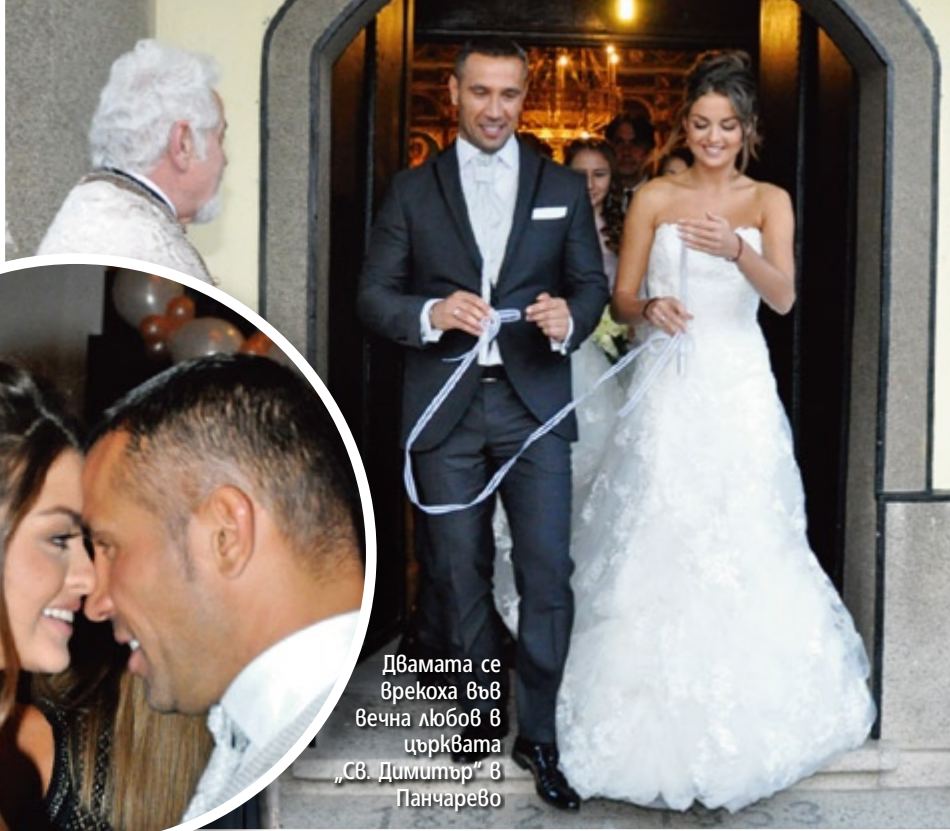
Двамата се врекоха във вечна любов в църквата „Св. Димитър“ в Панчарево