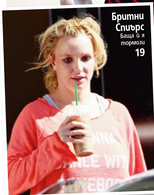
Бритни Спийрс Баща ѝ я тормози 19