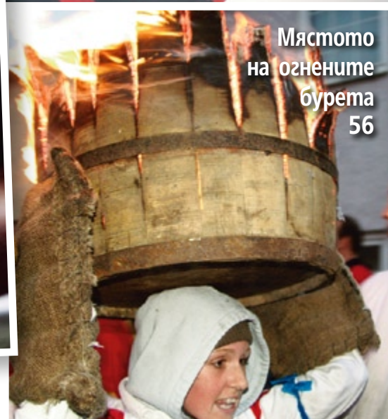
Мястото на огнените бурета 56