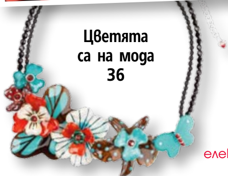
Цветята са на мода 36

Посетете страницата ни във facebook списание „Story“