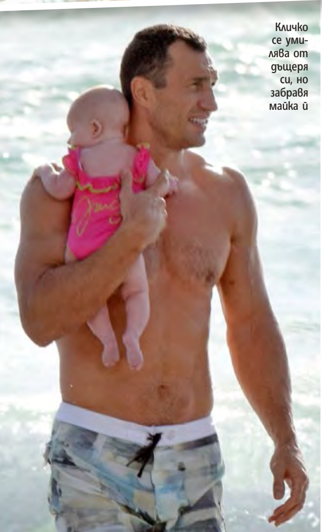
Кличко се умилява от дъщеря си, но забравя майка ѝ