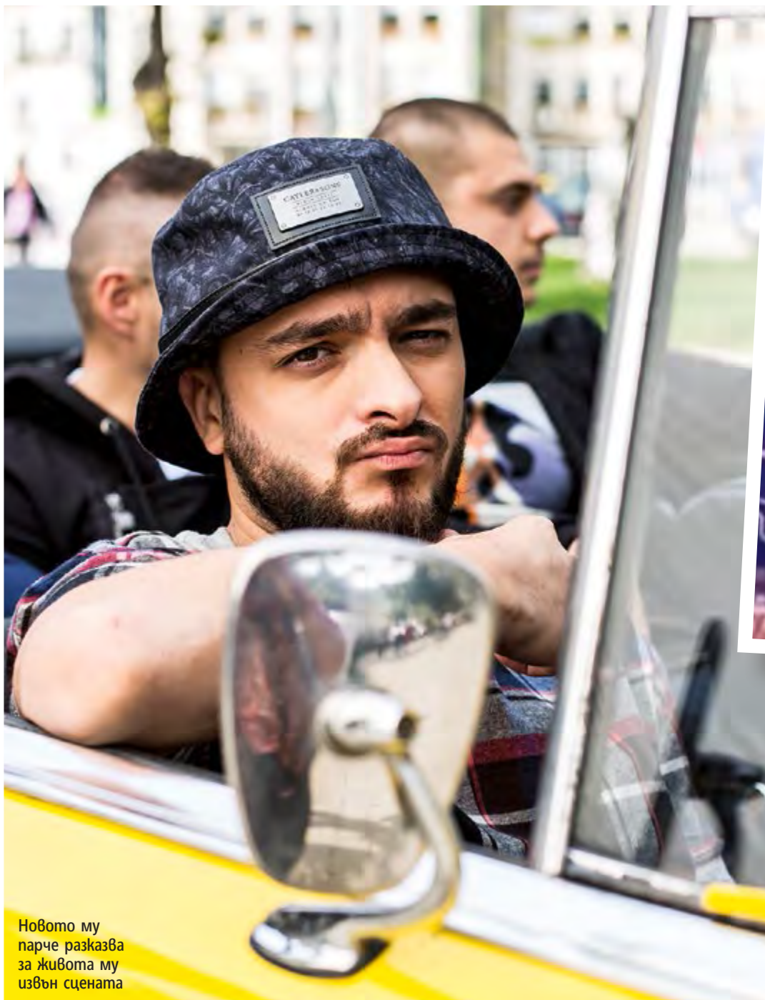
Новото му парче разказва за живота му извън сцената

Всеизвестно е, че Криско не обича да говори за личния си живот: „Предпочитам да се говори за песните ми“, заявява рапърът, за когото обаче близките твърдят, че макар да слага под похлупак най-интимните моменти от битието си, изобщо не е момче, на което му пука какво казват за него останалите. Предпочита да е позитивен, защото е разбрал, че както гледаш на живота, така и той гледа на теб. А той иска и го вижда в светлите му краски. „Спокойно момчета, днес е облачно, утре ще е слънчево и за нас“ - усмихва се обикновено на екипа си, когато има спънки, и гледа още със ставането от леглото си да изкрещи „уау“. А без проблеми не минава, разбира се, и при него. „Имам препятствия, при популярните винаги се намира някой, който иска да те смъкна надолу, но на мен не ми прави впечатление.“ Хората, с които работи, не се притесняват да го потърсят за съвет – какъвто и да е той, по което и да е време. Сред приятелите се нарежда и малката Дивна, която израсна пред погледа на публиката и от малкото момиченце, което пееше „Ти не можеш да ме спреш“, стана красива млада дама. Това е и парчето, което ги среща. А ги запознава Миро, когато поръчва на Криско да направи песента. „Трябва да извадим нещо, с което Дивна да избухне“ - казва му той. А Криско си мисли: „Тя е мал-