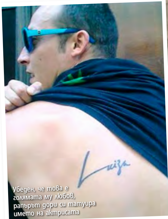
Убеден, че това е голямата му любов, рапърът дори си татуира името на актрисата

След три нещастни любови WOSH MC мечтае за семейство и дете, но го е страх да се влюби отново