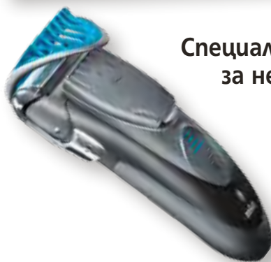
Специално за него 42

Посетете страницата ни във facebook списание „Story“