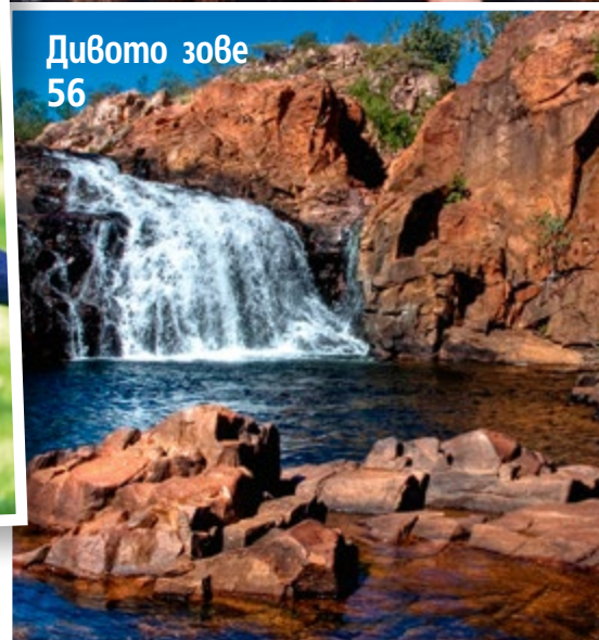
Дивото зове 56