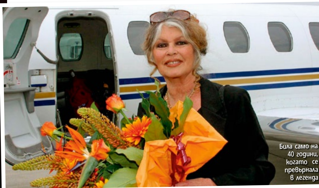
Била само на 40 години, когато се превърнала в легенда

Праменикът на съгбата, който ще разбие всички семейни планове, е бедният руски емигрант - режисьорът Роже Вадим, който я вижда 16-годишна на корицата на Elle. И обръща света, за да привлече вниманието на киното към момичето, което прилича на ангел. Резултатът – през 1952 година, само на 18, тя вече е на снимачната площадка и естествено е влюбена до полуда във Вадим, за когото се омъжва. Семейството е категорично против ▶