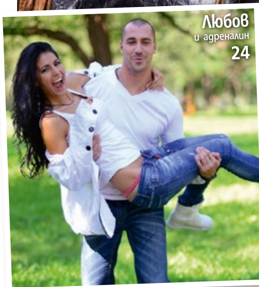
Любов и агреналин 24