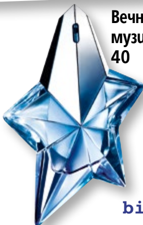
Вечните музи 40

Посетете страницата ни във facebook списание „Story“