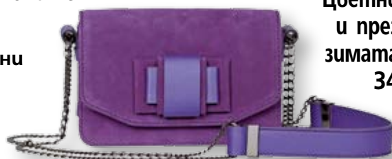
Цветни и през зимата 34

Посетете страницата ни във facebook списание „Story“