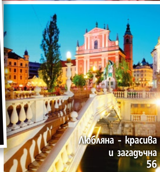
Любляна - красива и загадъчна 56