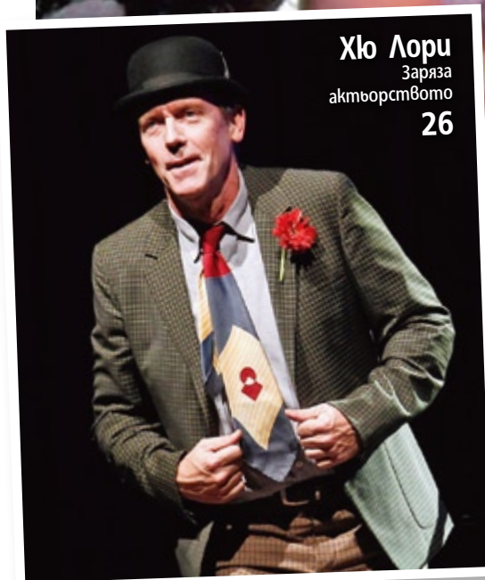
Хю Лори Зарязан актьорството 26