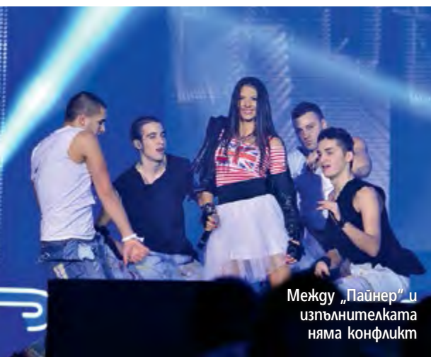
Между „Пайнер“ и изпълнителката няма конфликт

РАЙНА е сбъднала наполовина мечтата на живота си. Харесва ѝ да е „демоде“ в отношенията с мъжете