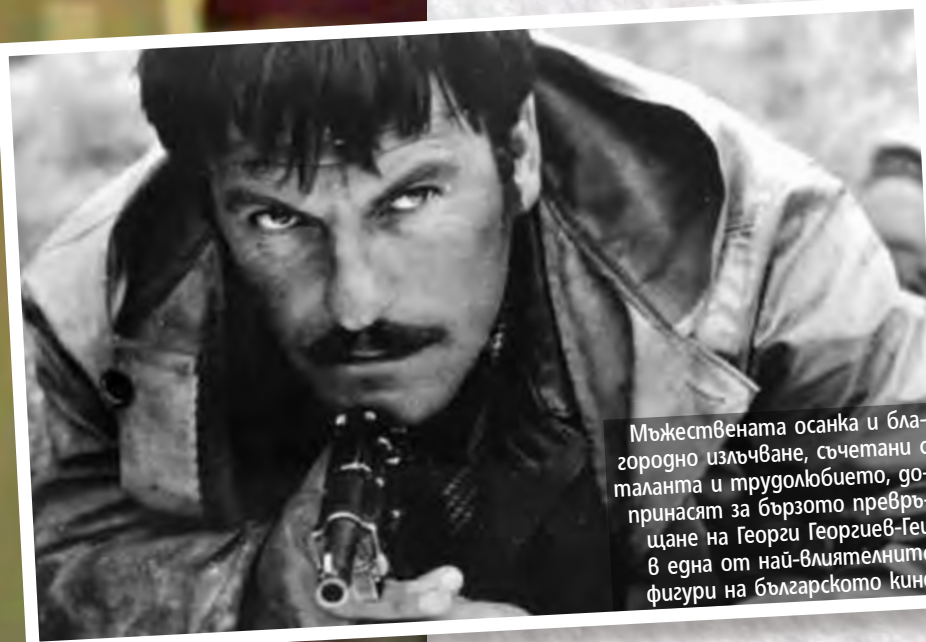
Мъжествената осанка и благородно излъчване, съчетани с таланта и трудолюбието, допринасят за бързото превръщане на Георги Георгиев-Гец в една от най-влиятелните фигури на българското кино

Дебютира в ролята на Петър от „Часът на щастието“ на Лозан Стрелков и скоро се превръща в един от театралните ни корифеи, създавайки поредица от великолепни образи в постановки, като „Горещо сърце“ (1957), „Пред буря“ (1960), „Иван Шишман“ (1961), „Златната карета“ (1967), „Монахът и неговите синове“ (1968), „Боряна“ (1969), „Еснафи“ (1971), „Тази малка земя“ (1974), „Хъшове“ (1976), „Бяг“ (1977), „Опит за летене“ (1979), „Под игото“ (1981), ▶