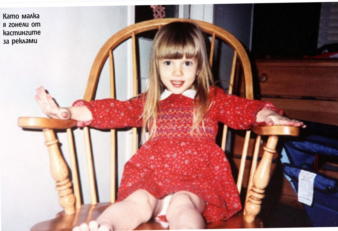
Като малка я гонели от кастингите за реклами