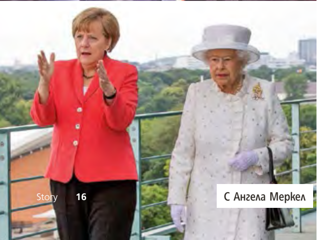
С Ангела Меркел