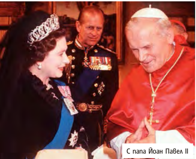
С папа Йоан Павел II