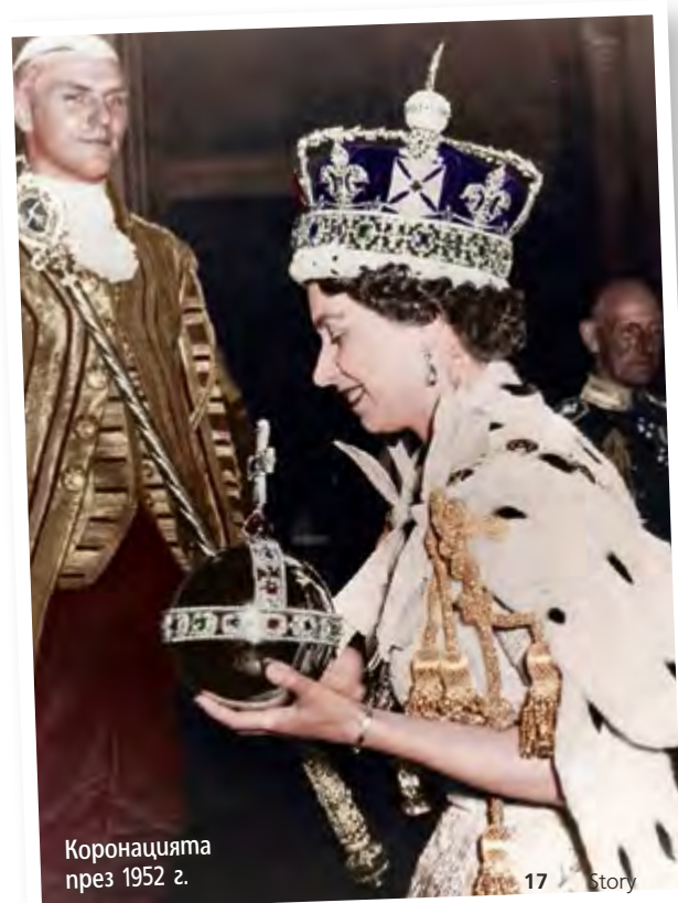
Коронацията през 1952 г.

На 25 години Лилибет получава най-мечтаното и най-тежко наследство – короната, и се превръща в Нейно Величество Елизабет II. Живата история на XX век, така летописците наричат Нейно Величество Елизабет II. Прекарала детството ▶