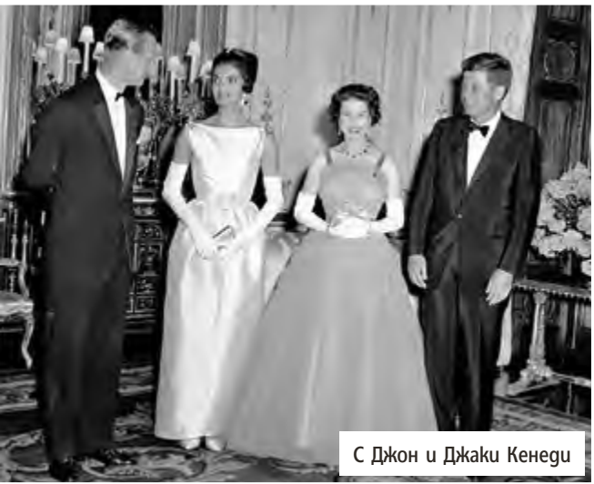
С Джон и Джаки Кенеди