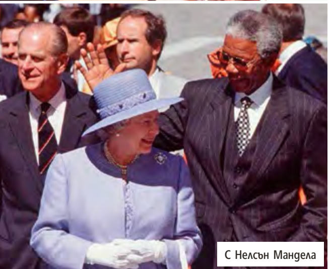
С Нелсън Мандела