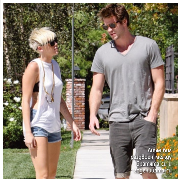
Лиъм бил разгвоен между братята си и годеницата си

МАЙЛИ САЙРЪС тайно обикаля булчински магазини, докато братята на гаджето ѝ го убеждават да я забрави завинаги