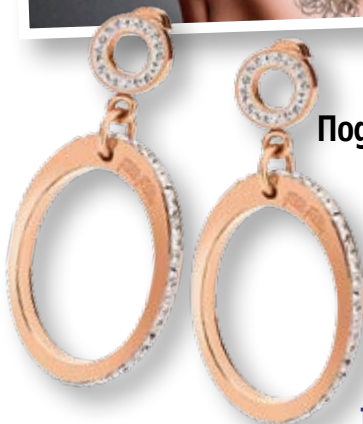
Подходящият аксесоар 39

Посетете страницата ни във facebook списание „Story“