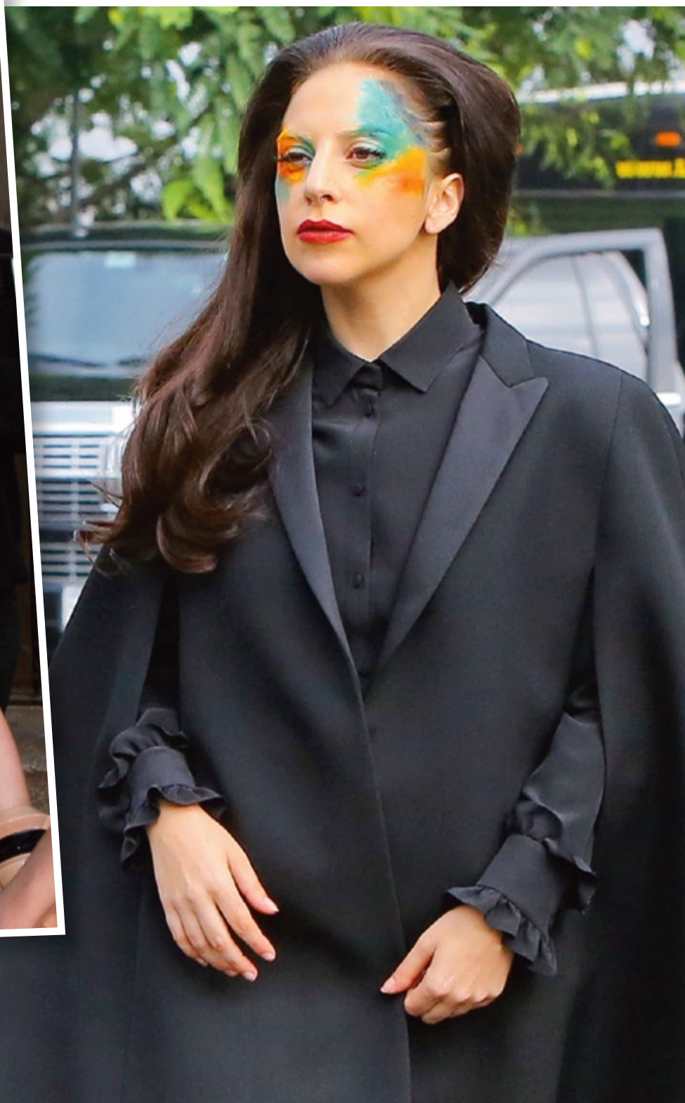
ЛЕЙДИ ГАГА на война с хакерите и с Кейти Пери