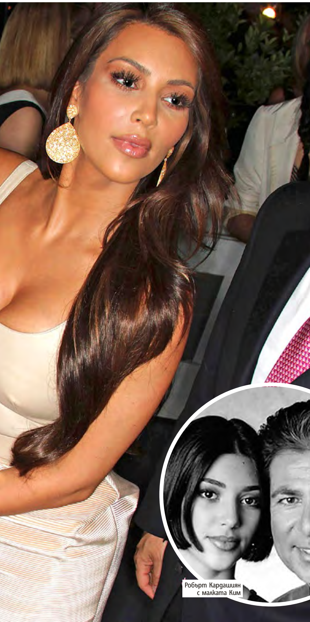
Робърт Кардашиян с малката Ким

К им Кардашиян често обича да казва, че е по-умна, отколкото хората мислят. И това е самата