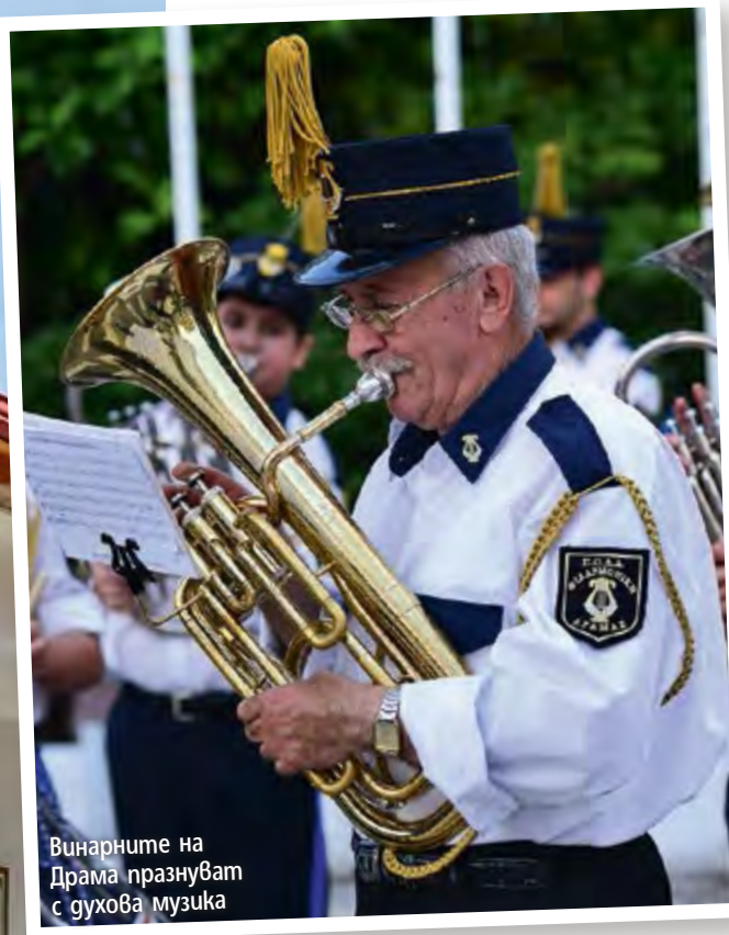
Винарните на Драма празнуват с духовна музика