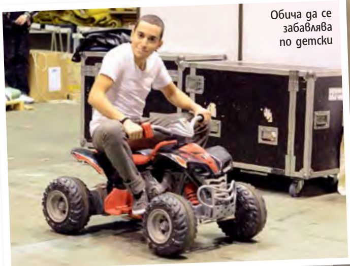
Обича да се забавлява по gemcki