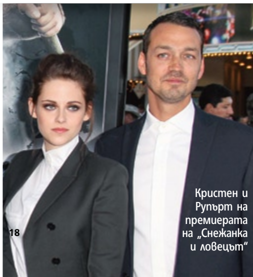
Кристен и Рупърт на премиерата на „Снежанка и ловецът“