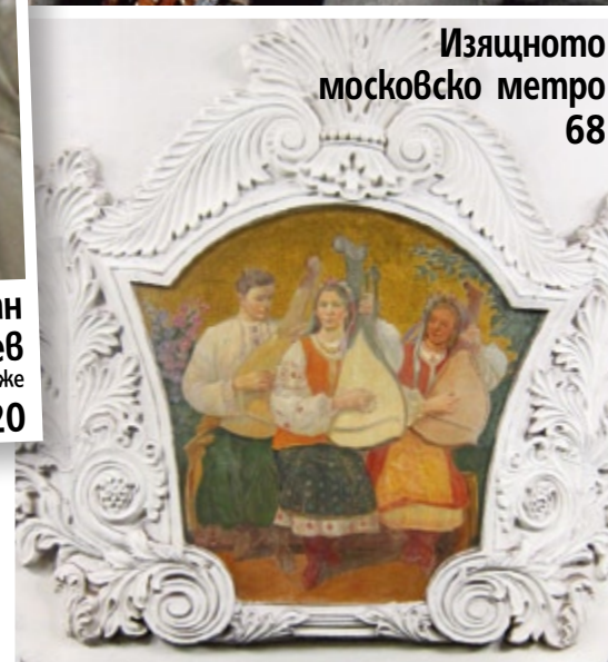
Изящното московско метро 68

Посетете страницата ни във facebook списание „Story“