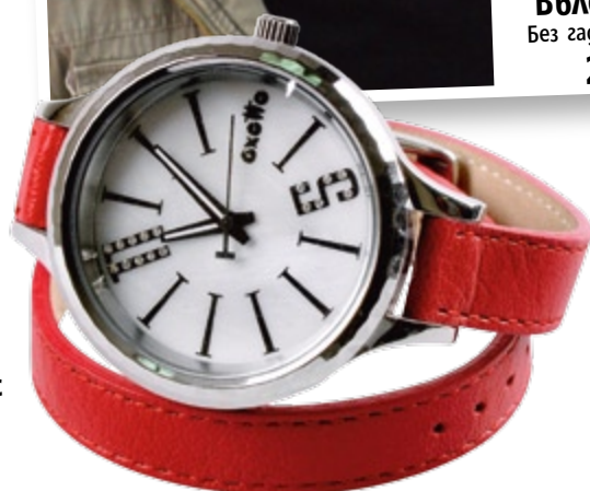
Горещи аксесоари 44