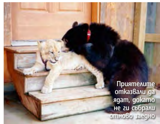
Приятелите отказвали да ядат, докато не ги събрали отново заедно

ното блъскане в решетките на твърде тясната клетка, която обитавал. Нашийникът на Балу, който никога не бил свалян, бил толкова отеснял, че направо сраснал с кожата и вече я задушавал. За да ги спасят, активисти от неправителствена организация за диви животни в беда, ги отвели в приют с емблематичното име „Ноев ковчег“.