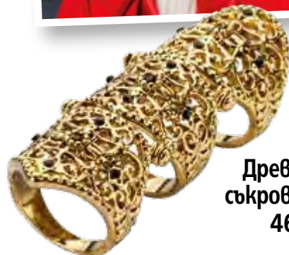
Древни съкровища 46

Списание то може да закупите и в електронен вариант от helikon.bg и biblio.bg