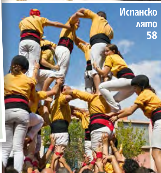
Испанско лято 58