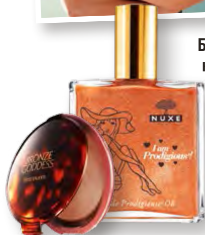
Бронзът е навсякъде 42

Посетете страницата ни във facebook списание „Story“