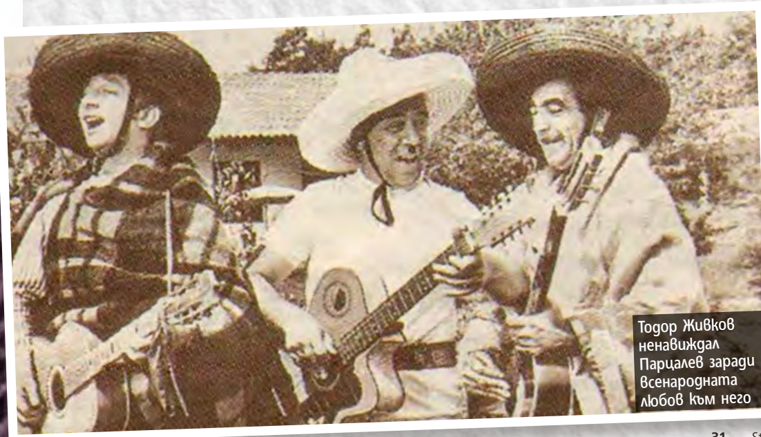
Тодор Живков ненавиждал Парцалев заради всенародната любов към него

„Коскоджамити съдии, а се занимават с наш’те дупетии!“