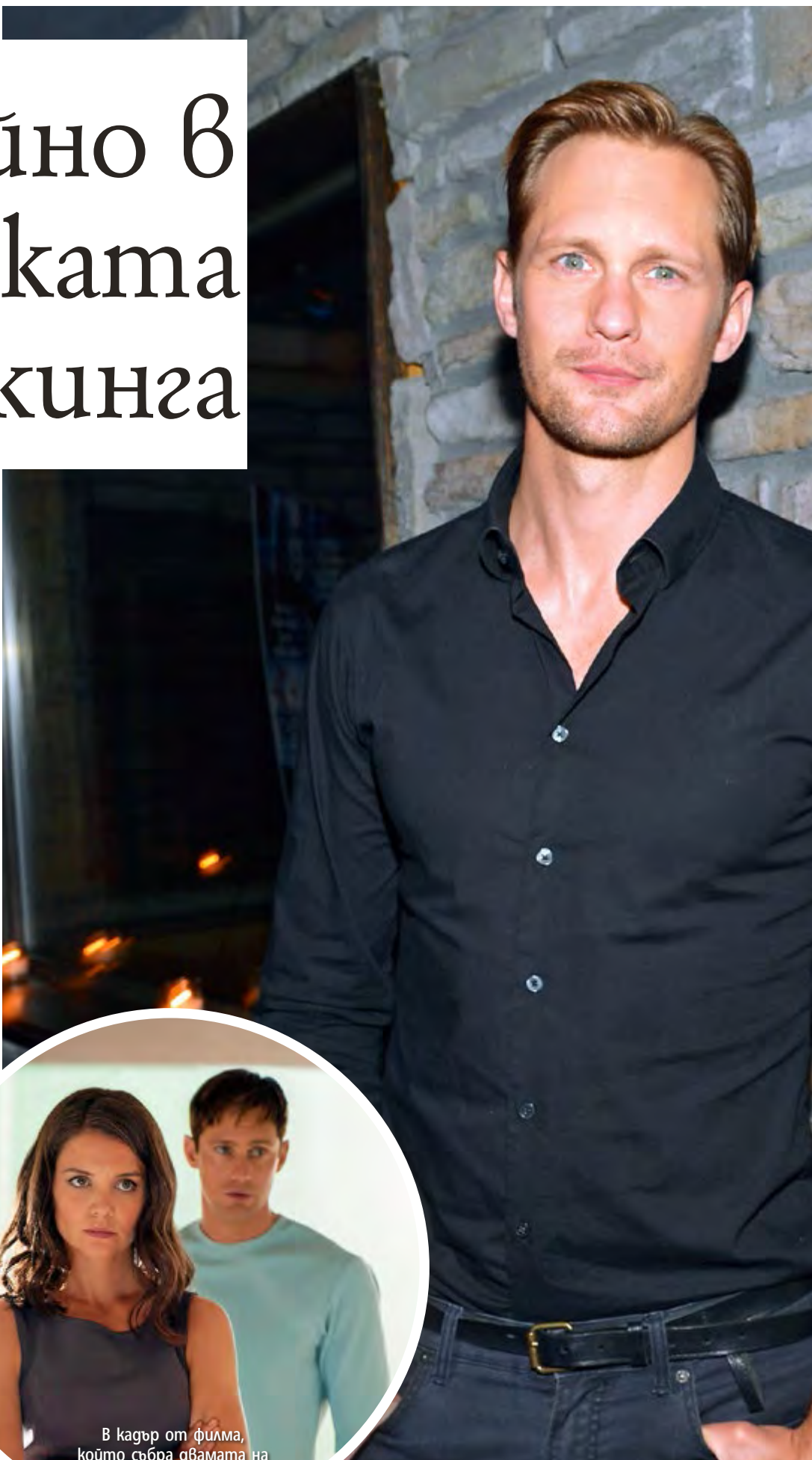
В кадър от филма, който събра двамата на снимачната площадка

Холмс е сама, поне официално , вече две години, откакто се разведе с Том Круз, а сърцето на героя на „Истинска кръв“ също е свободно, въпреки промъкващите се слухове за връзка с Камерън Диас. Нещата се променят преди година, когато двамата се събират за снимките на филма The Giver , който вече предстои да излезе на екран. И както