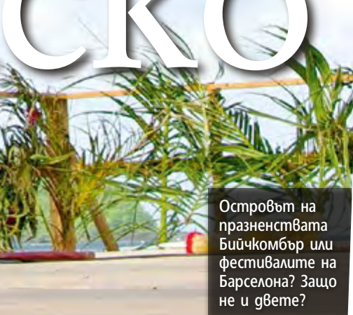
Островът на празненствата Бийчкомбър или фестивалите на Барселона? Защо не и двете?