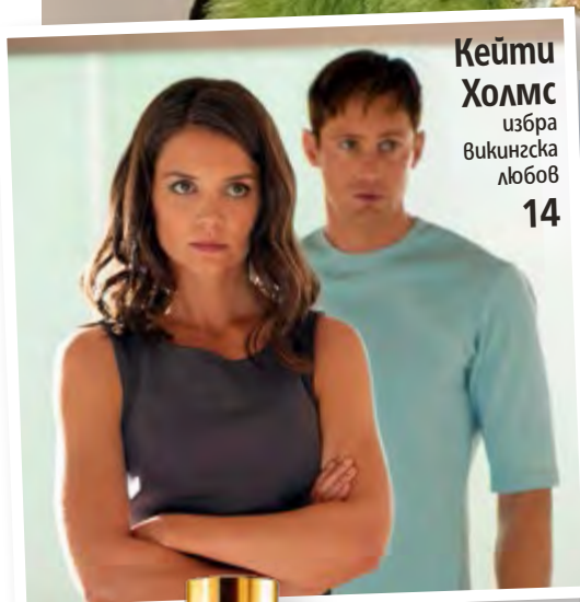
Кейти Холмс избра викинзска любов 14