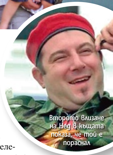
Второто влизане на Нег в къщата показва, че той е пораснал