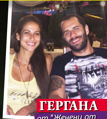
ГЕРГАНА от "Женени от пръв поглед"

ХЮ ДЖАКМАН СЪС ЗАБРАНА ДА ВИЖДА АНДЖЕЛИНА ДЖОЛИ