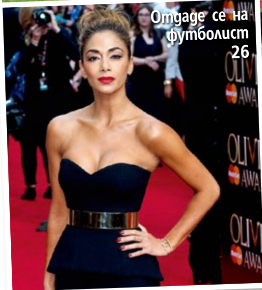
Отдаде се на футболист 26