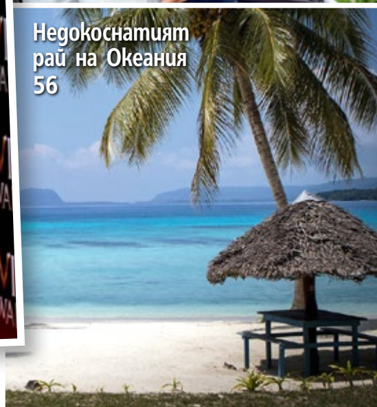
Недокоснатият рай на Океания 56