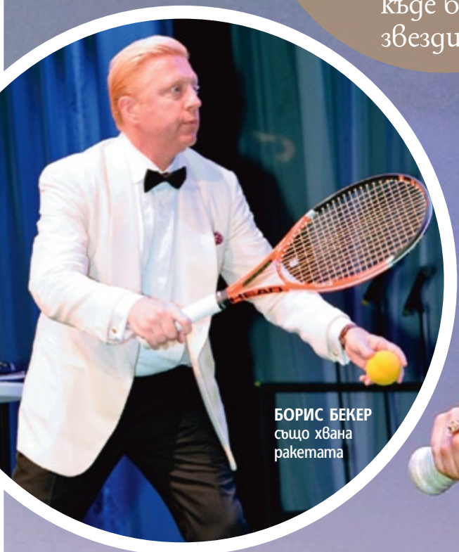
БОРИС БЕКЕР също хвана ракетата

КЕЙТ ХЪДСЪН направи ис- тинско шоу на импровизирания корт