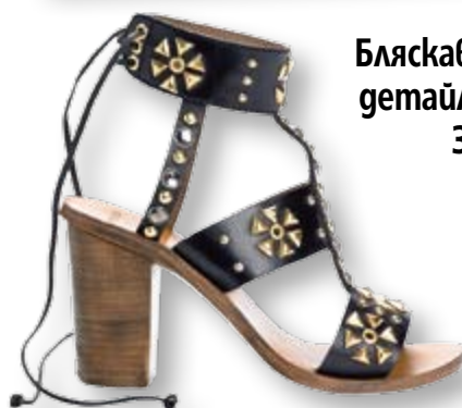
Бляскави детайли 34