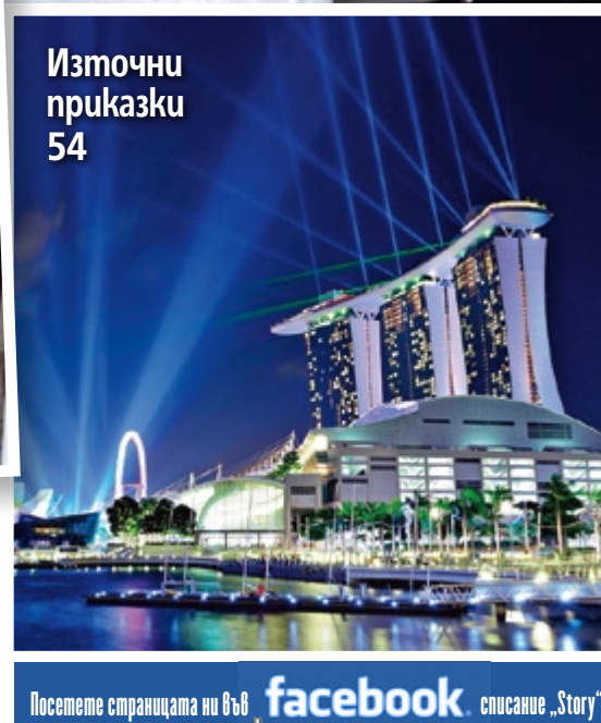
Източни приказки 54

Посетете страницата ни във facebook списание „Story“