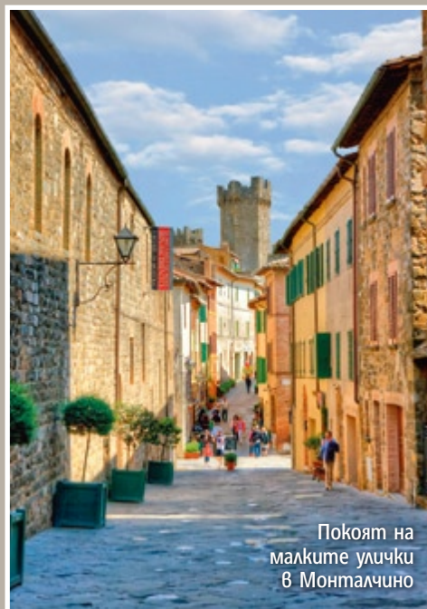
Покоят на малките улички в Монталчино

— ❧ ❧ — Винени битки в Ла Риоха, вековни традиции в Тоскана или изискана приказка в Бордо – лозята и винарните са светилища на винените пилигрими