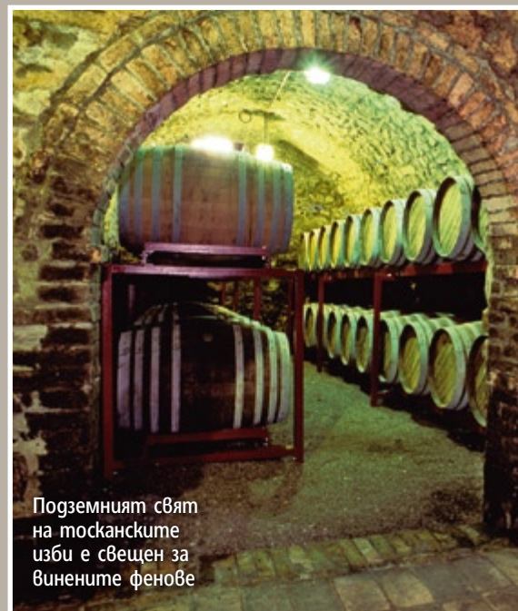
Подземният свят на тосканските изби е свещен за винените фенове

Тоскана е другото име от библията на винените пилигрими. Тази итали-