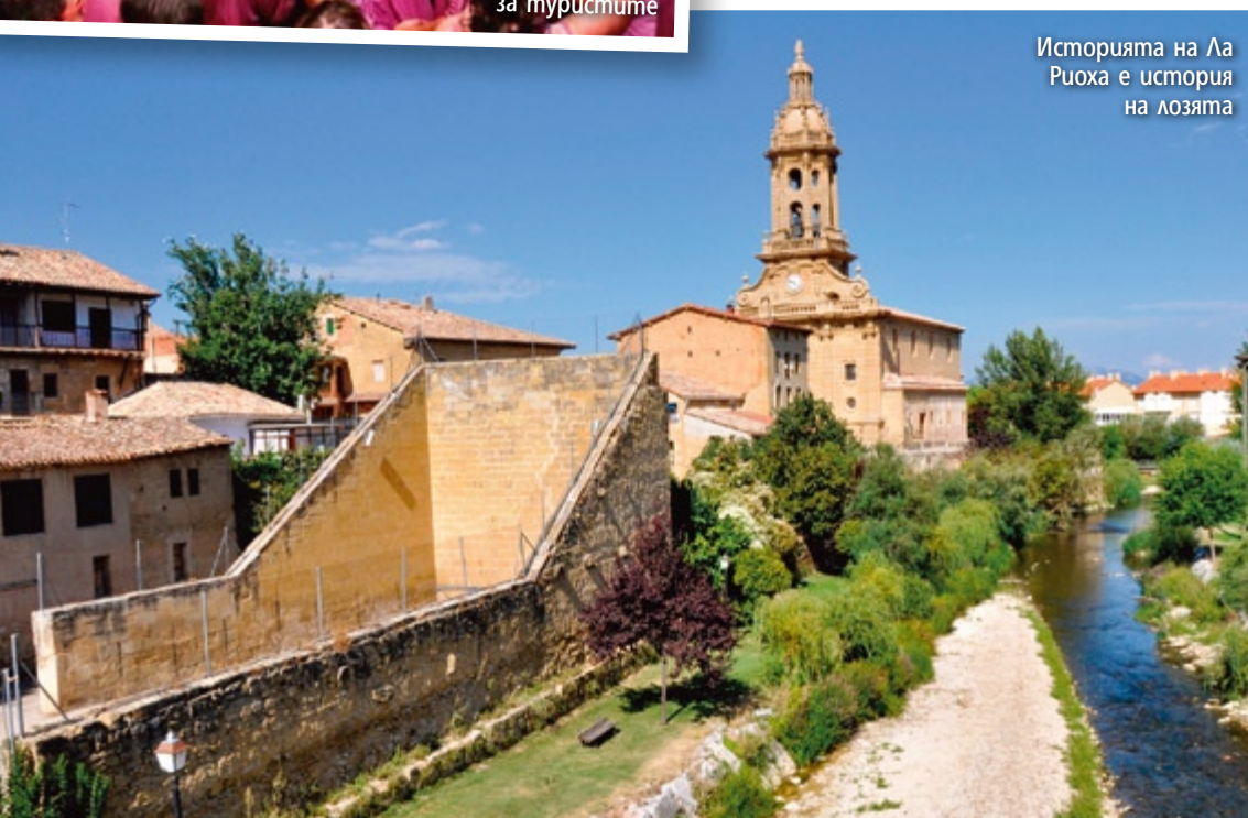
Историята на Ла Риоха е история на лозята

Дори името на тази северноиспанска област идва от ароматния букет различни сортове грозде, от които се е правело виното риоха. Целуната отново от галения средиземноморски климат, хълмистата местност дава живот на 14 000 лозови масива, а сред тях са 150 винарни, които произвеждат 250 милиона литра вино годишно. Най-много е червеното, но и белите не са за пренебрегване, както и модното напоследък розе. Историята на хората по тези места е всъщност история на лозята и виното, което официално се произвежда тук от десети век. Сътворяването на напитката било така издигнато в култ, че през 1635 година кметът на главния тогава град Логро забранил преминаването на каруци и дори на ръчни колички по улиците край избите, защото вибрациите, които предизвиквали, можели да влошат качеството на виното. В зависимост от това кой сезон ще изберете за винена обиколка на Ла Риоха, задължително ще попаднете на някой от многобройните фестивали и живи фолклорни традиции. Една от най-старите е танцуването на кокили, което се провежда почти всеки месец. Всяко лято тук се разгаря La Batalla del Vino (винената битка), която неизвестно защо е посветена на местен светец, покровител на селището Харо. Още рано сутринта улиците се изпълват с хора, които носят задължително пълни с вино кожени мехове, които насочват към всеки срещнат, и го къпят със скъпоценното питие. Това взаимно