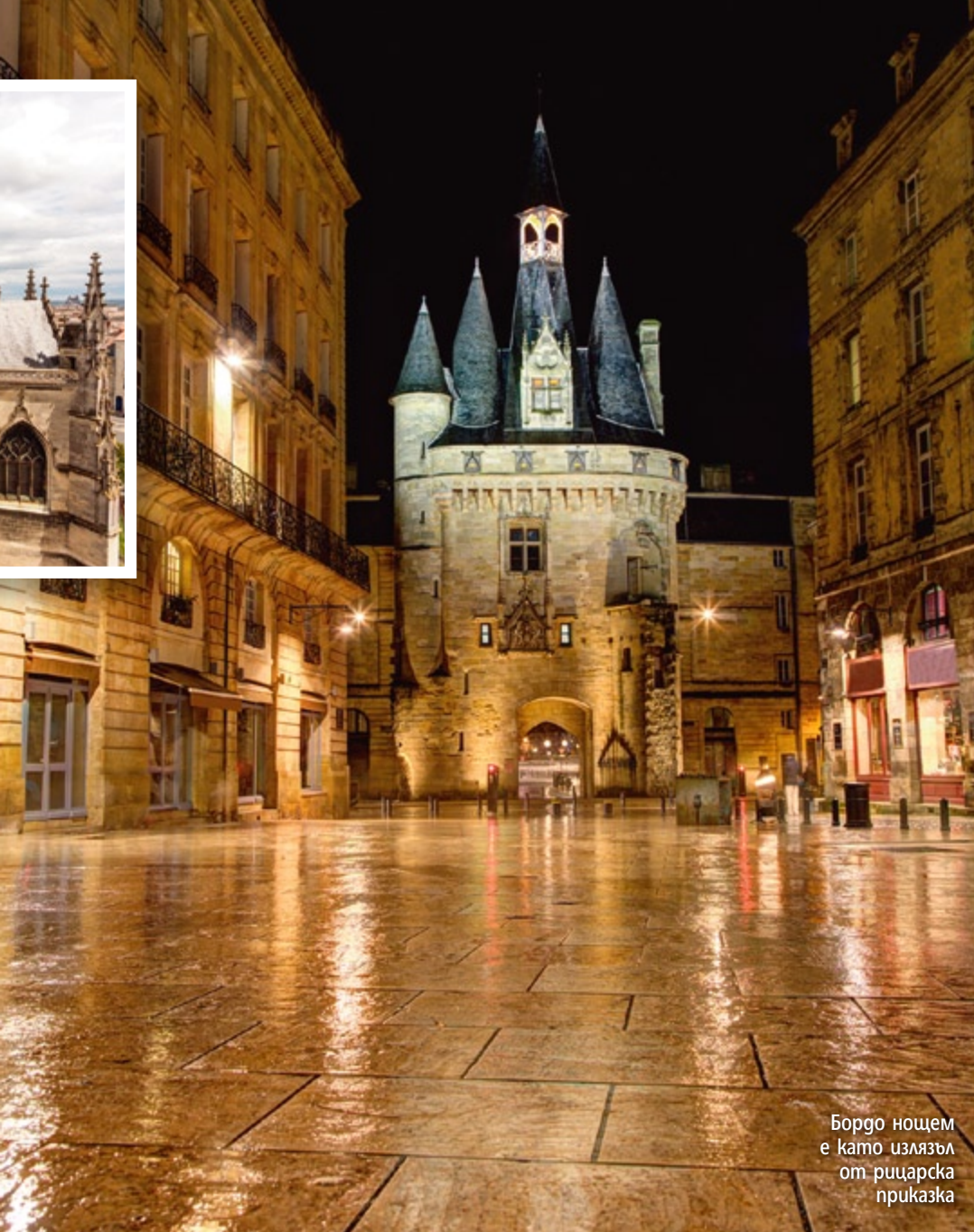
Бордо нощем е като излязъл от рицарска приказка

анска провинция от векове е известна като мека на виното и храната и до днес не престава да бъде неизменно в челните места на Forbes, когато стане дума за винените дестинации на света. Най-добра стартова точка за опознаване на винена Тоскана е Флоренция. Самолетът до там и обратно излиза между 350 и 400 евро. Еднодневен винен тур пък варира от 120 до 200 евро в зависимост от броя на хората в групата и глезотиите, които искате да включите.