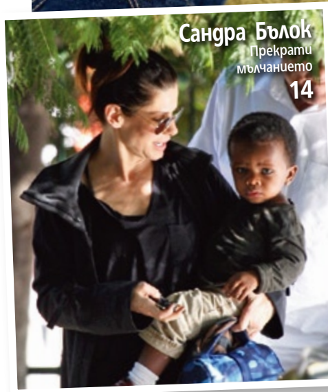
Сангра Блок Прекрати мълчанието 14