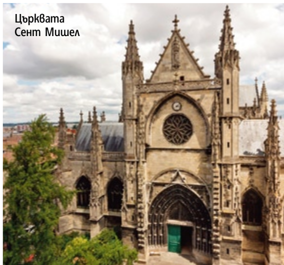
Църквата Сент Мишел

поливане продължава, докато свършат амунициите, а участниците до един са мокри и в повечето случаи почернели от танина. Така издокарани, всички се събират на площада за луди танци и естествено, за много пиене.