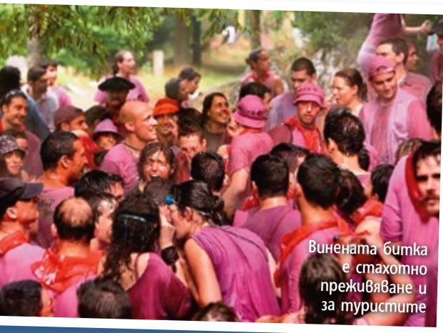
Винената битка е стахотно преживяване и за туристите

На 400 километра от Бордо пък вече сте в Ла Риоха, Испания. С кола разстоянието се взима за 5-6 часа заради ограничението на скоростта до 60 км/час, а с влак пристигате за около 3 часа. Почитателите на морето избират пътешествие с корабче и автомобил, което отнема около половин ден.