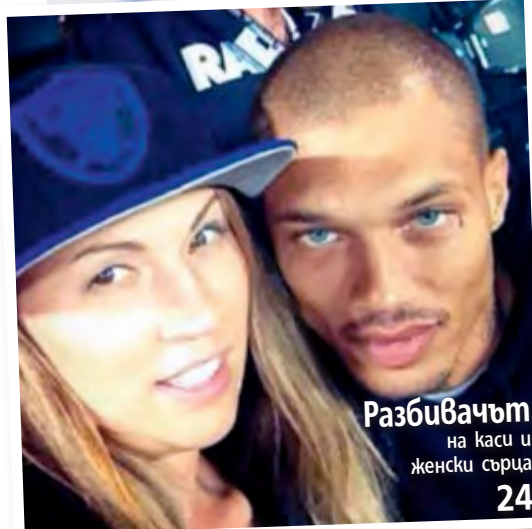
Разбивачът на каси и женски сърца 24