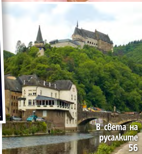
В света на русалките 56

Посетете страницата ни във facebook списание „Story“