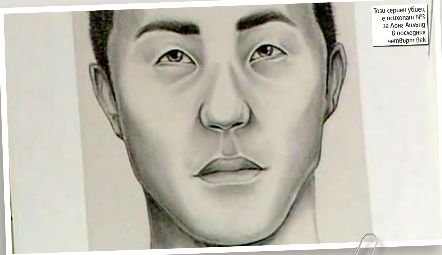
Този сериен убиец е психопат №3 за Лонг Айленд в последния четвърт век

ТОЙ УБИВА ПРОСТИТУТКИ , разчленява телата на някои от тях и ги разхвърля по запустели места. А полицията и до ден днешен е на една крачка за него