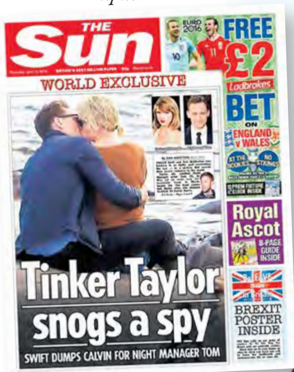
Така чаканата целувка между двамата излезе на първа страница във вестник The Sun