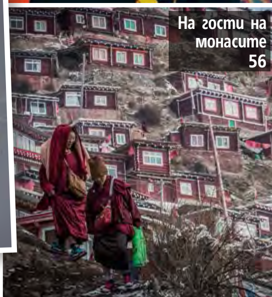
На гости на монасите 56