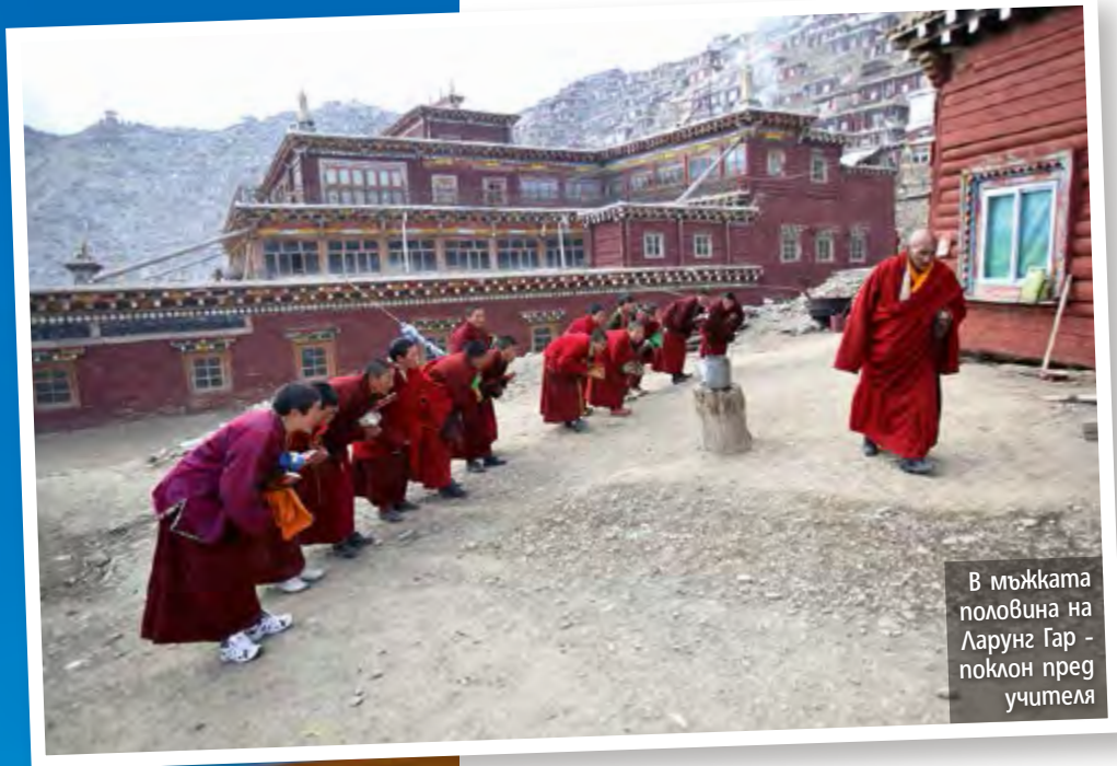
В мъжката половина на Ларунг Гар - поклон пред учителя