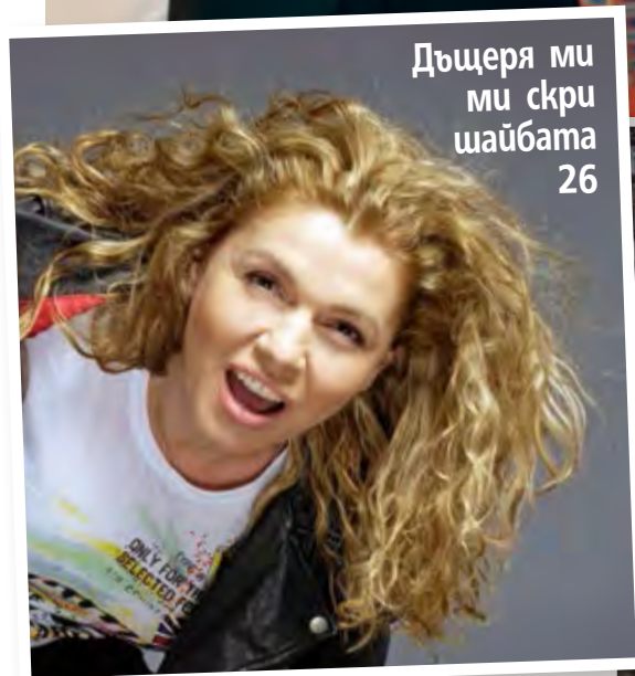
Дъщеря ми ми скри шайбата 26