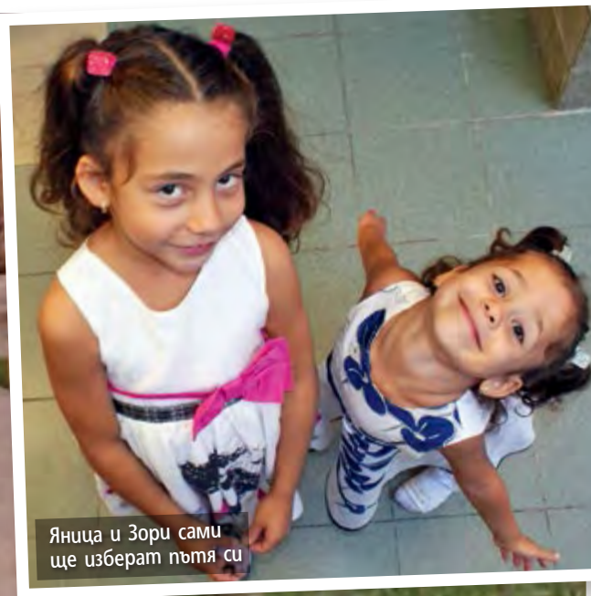
Яница и Зори сами ще изберат пътя си