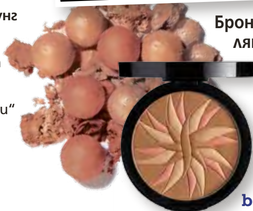
Бронзирай лялото 40

Посетете страницата ни във facebook списание „Story“