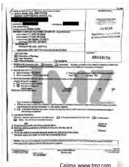
Сайта www.t TMZ.com се гобра го копие от молбата за развод на Грифит

Макар и злословниците да ги разделяха малко след като си казаха „да“, двамата продължаваха да са заедно през годините и демонстрираха любовта и подкрепата един към друг дори в най-трудните моменти. И точно, когато вече никой не вярваше, че Антонио ще бие отбой заради препятствията, през които се опитват да преминат не от вчера, новината дойде – известният испански сърце-разбивач и блондинката тръгнаха в различни посоки. За това тръби американският сайт, който успя да се добере до копия на официалните съдебни документи.