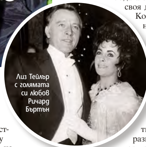
Лиз Тейлър с голямата си любов Ричард Бъртън

омъжи цели 8 пъти. Но - всеки може да бъде щастлив според това, което му диктува сърцето, стига да не пречи на другите. „Не е важно, че това е шестата ми поредна сватба. Важното е, че е сегашна. Любовта съществува!“ - казва Ирен, която никога не е крила, че е дълбоко вярваща, както и настоящият ѝ съпруг. Story пожелава на младоженците дълъг и щастлив съвместен живот и се надява пълната с енергия актриса никога да не реши да догонва рекорда на холивудската си колежка Лиз.