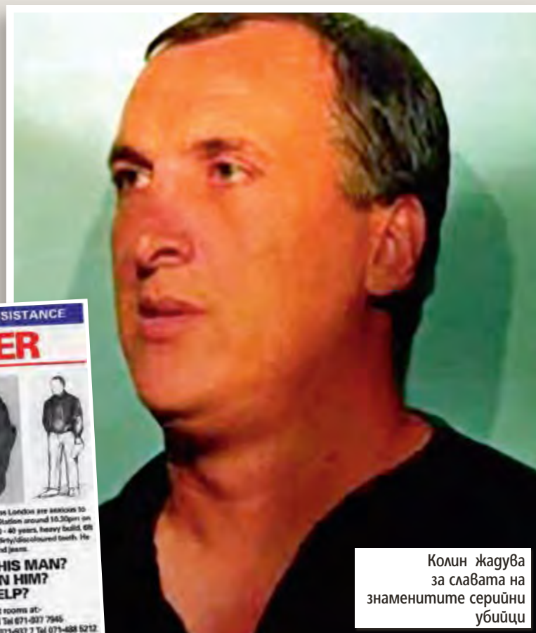
Колин жагува за славата на знаменитите серийни убийци

на Питър предстои да се развие зловеща сцена.