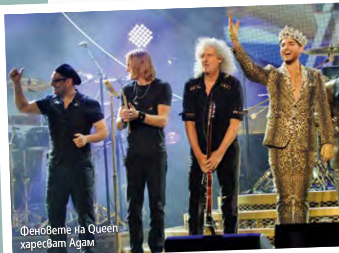
Феновете на Queen харесват Адам

АДАМ ЛАМБЪРТ стана популярен с предаването American Idol . Шоуто му помогна не само да се срещне с легендите от Queen , но и да стане техен вокалист