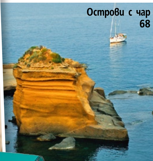
Острови с чар 68