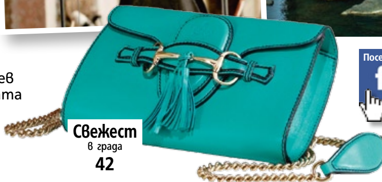
Свежест в града 42

Посетете страницата ни във facebook списание „Story“