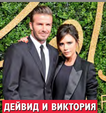
ДЕЙВИД И ВИКТОРИЯ