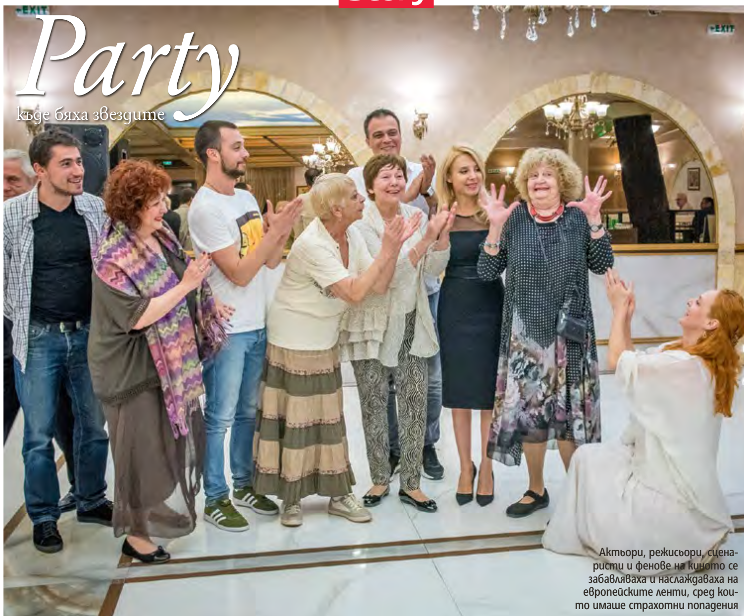
Актьори, режисьори, сценаристи и фенове на киното се забавляваха и наслаждаваха на европейските ленти, сред които имаше страхотни попадения