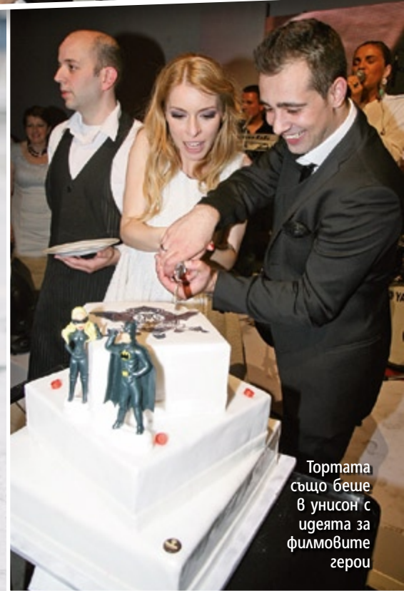
Тортата също беше в унисон с идеята за филмовите герои