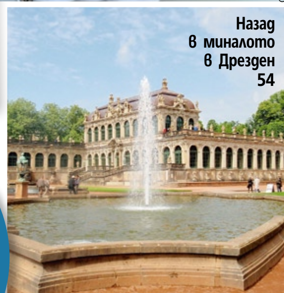
Назад в миналото в Дрезден 54

Посетете страницата ни във facebook списание „Story“