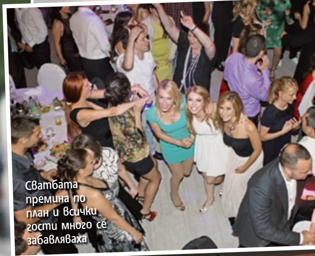
Сватбата премина по план и всички гости много се забавляваха