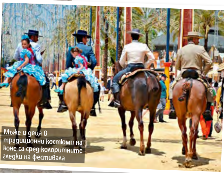
Мъже и деца в традиционни костюми на коне са сред колоритните гледки на фестивала

Панаирното село не е егинствена-та запазена за фиестата територия. В дните и нощите на панаира цяла Севиля се отдава на основното си занимание – да танцува, да пее и да свири, да пие и да кръстосва града на кон. Във всеки от дните на панаира, в продължение на седмица, някъде към обяд се появяват ездачите – обикновено на групи, яхнали специално нагиздените си коне. Задължително ▶