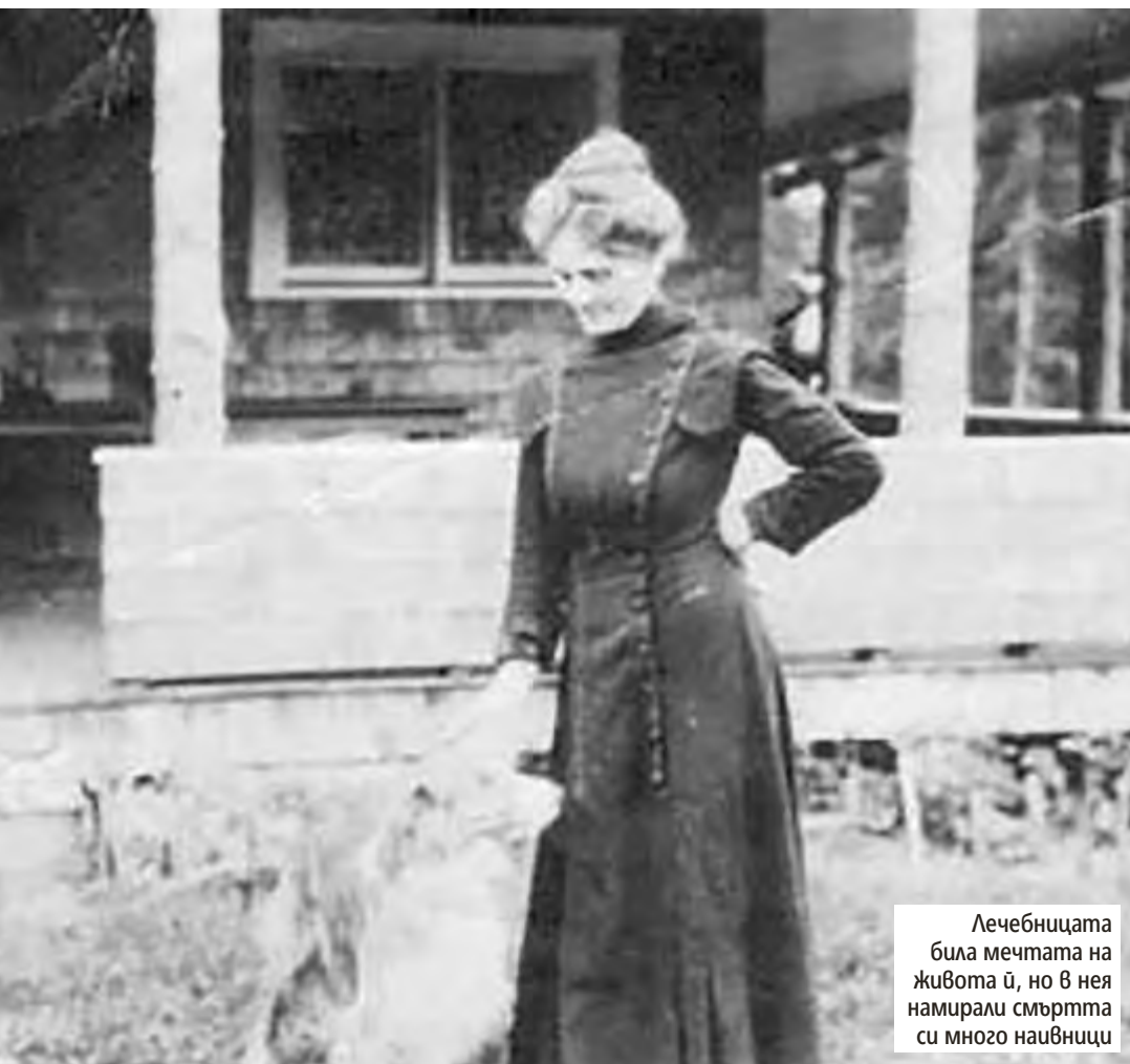
Лечебницата била мечтата на живота ѝ, но в нея намирали смъртта си много наивници