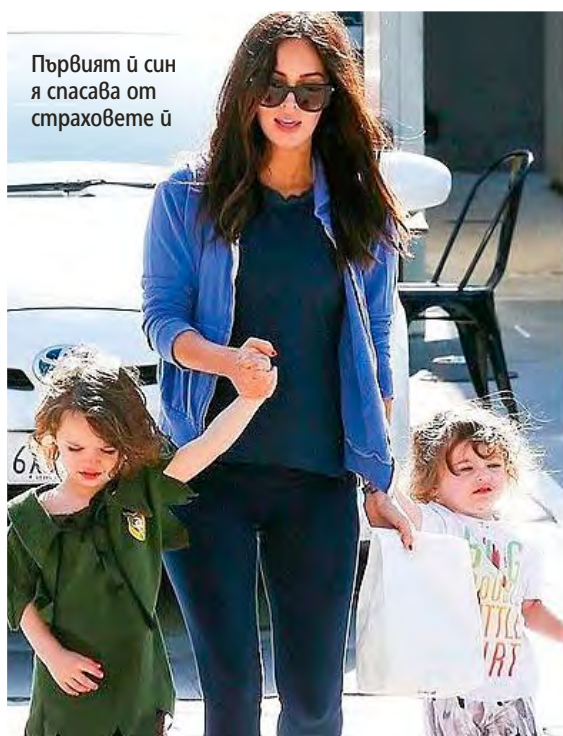
Първият ѝ син я спасява от страховете ѝ

За наказание на момичето предложени два варианта: или да стои три дни на входа на магазина с табела „Аз откраднах от Wal-Mart“, или да опакова коледни подаръци. Не е изненада, че Меган избира втория вариант.