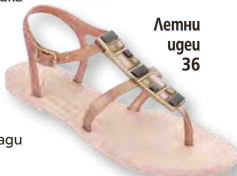
Летни идеи 36

Посетете страницата ни във facebook списание „Story“