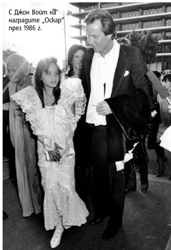
С Джон Войт на наградите „Оскар“ през 1986 г.

Историята на майка ѝ, изоставила собствената си артистична кариера, за да се отдаде на тривиална борба за препитанието на двете си деца, е една от най-повтаряните от Джоли. Саможертвата на Марчелин Бертран до такава степен обсебва подрастващата ѝ дъщеря, че я бележи за цял живот. Не е нужно някой да е психолог, за да забележи пиетета на Джоли и усещането за изоставеност, което се загнездва в нея, когато майка ѝ си отива от този свят, победена от рак на гърдата. Страхът от болката на изоставеното малко момиченце я тласка към решението да премахне собствените си гърди, за да не би нейните деца да останат без майка. Дали това не е поредното безумство на актрисата е въпрос, който едва ли ще намери своя отговор. Пък и „лудостите“ в живота ѝ са част от собствената ѝ идентичност. Ненавършила 12 години, тя вече се е разходила по червения килим на най-престижните награди - „Оскар“, отново под ръка с баща си и облечена в дълга кукленска рокля. Пълно лицемерие, както сама го нарича само няколко години по-късно. Защото нито червеният ки- ▶