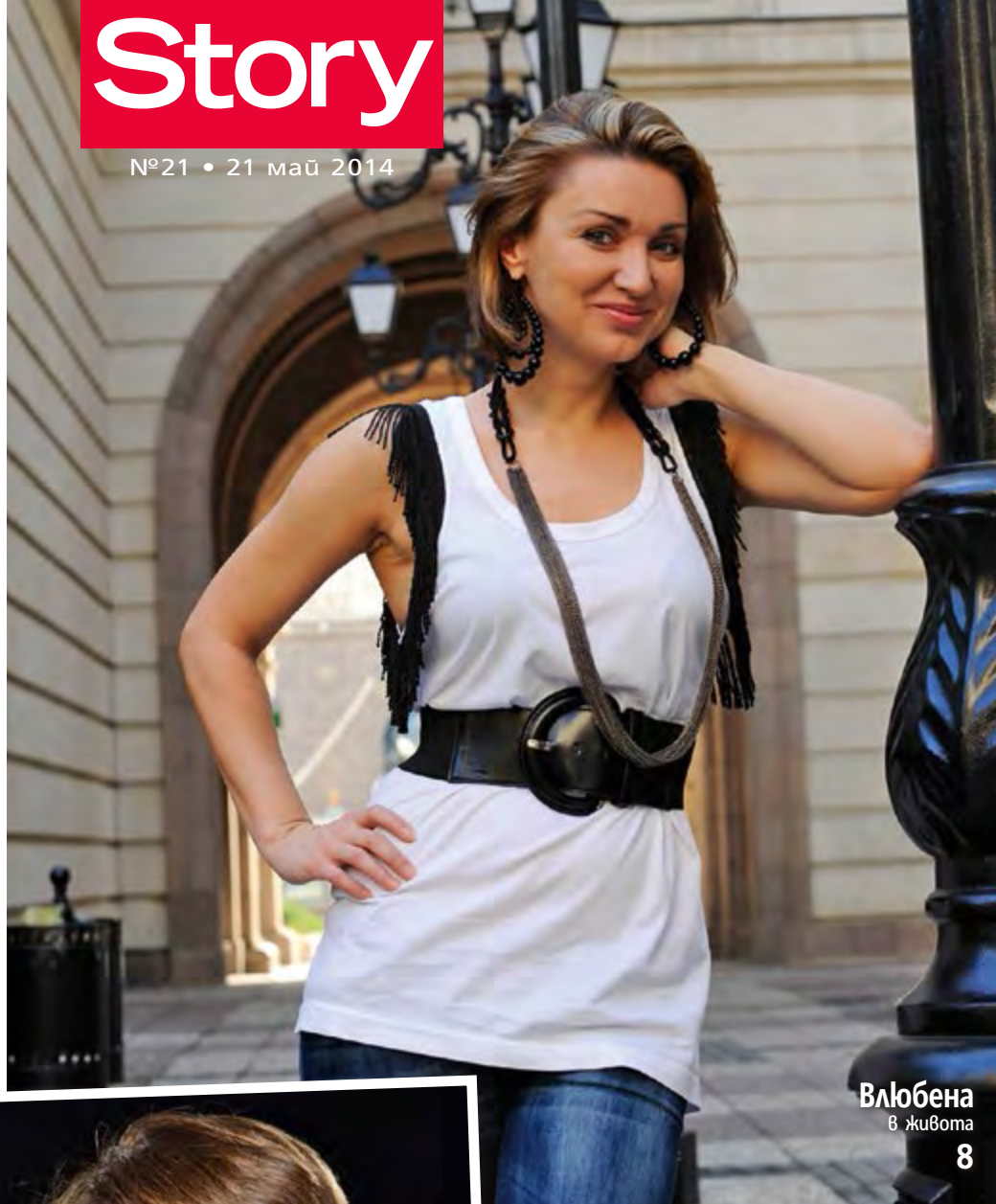
Влюбена в живота 8